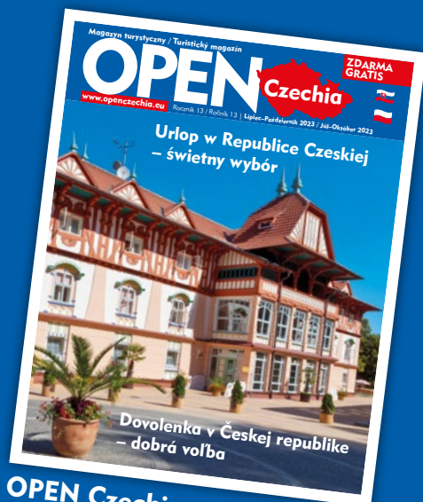
OPEN Czechia (tištěný – polsky, slovensky)