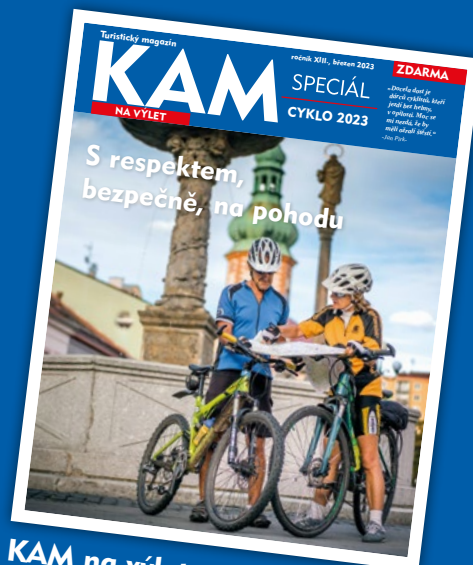
KAM na výlet (tištěný – český)