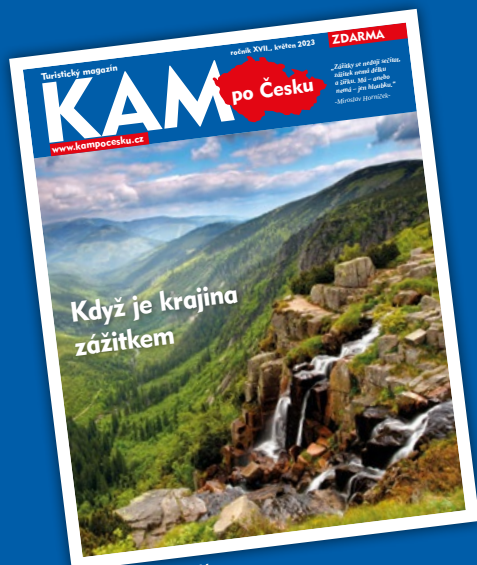
KAM po Česku (tištěný – český)