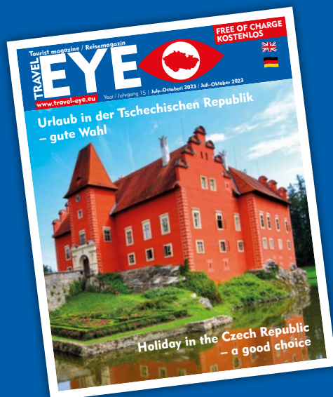
Travel EYE (tištěný – německy, anglicky)

KAM ® VYDAVATELSTVÍ po Česku www.kampocesku.cz