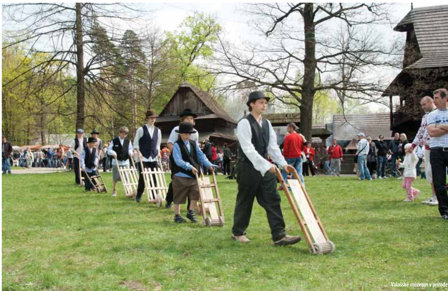
Valašské múzeum v prírode