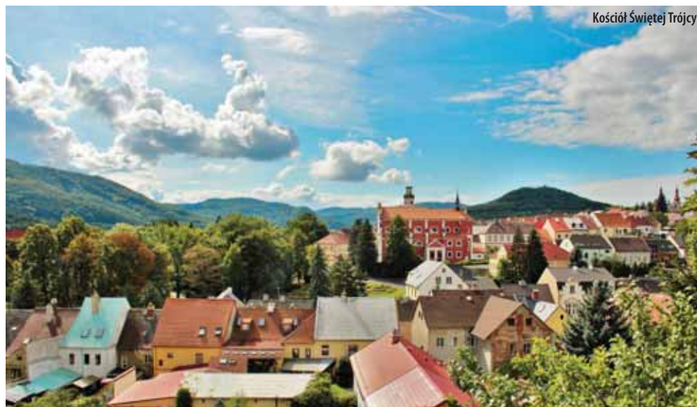
Kościół Świętej Trójcy

i pakietów wellness, które obejmują pobyt w krytym basenie z jacuzzi i sauną. Przyjemne spędzenie czasu oferuje restauracja i kawiarnia, a popularnością cieszą się też korty tenisowe.