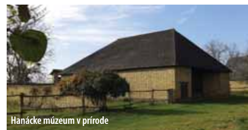
Hanácke múzeum v prírode