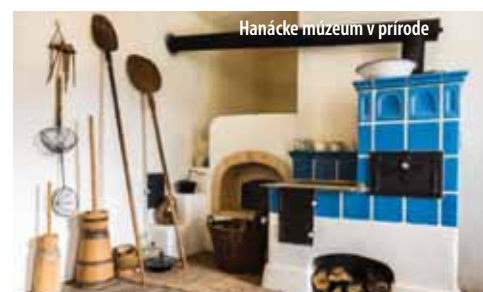
Hanácke múzeum v prírode