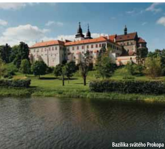
Bazilika svätého Prokopa