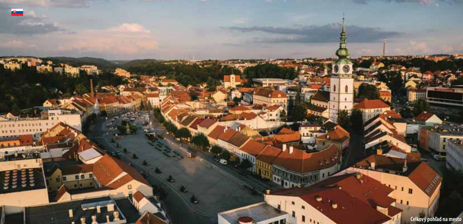
Celkový pohľad na mesto