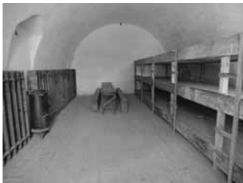
Jedna z cel v Malej pevnosti