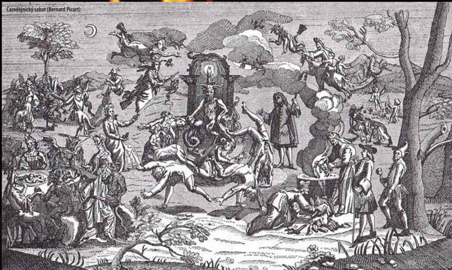
Čarodějnický sabat (Bernard Picart)

Obecnie w nocy z 30 kwietnia na 1 maja w Czechach, ludzie nadal spotykają się przy płonących ogniskach, traktując to jednak przede wszystkim jako zabawę, od której całkowicie oddzielają wszelkie kwestie religijne. Dzieci kochają to święto, młodzi korzystają z jego uroków, średnie pokolenie skupia się w tym czasie na biesiadowaniu, a najstarsi z zainteresowaniem się wszystkiemu przyglądają. Słowem: dla każdego coś miłego.