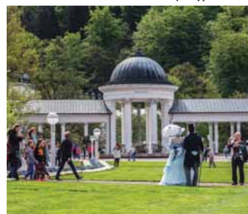
Rozpoczęcie sezonu uzdrowiskowego