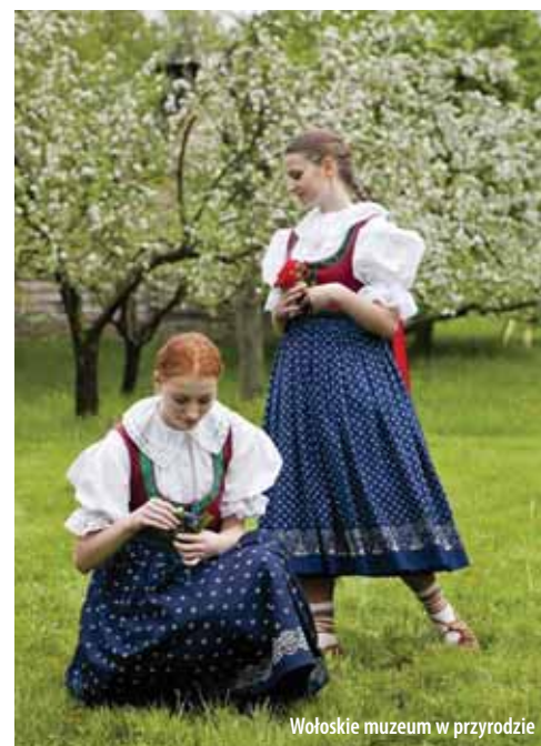
Wołoskie muzeum w przyrodzie