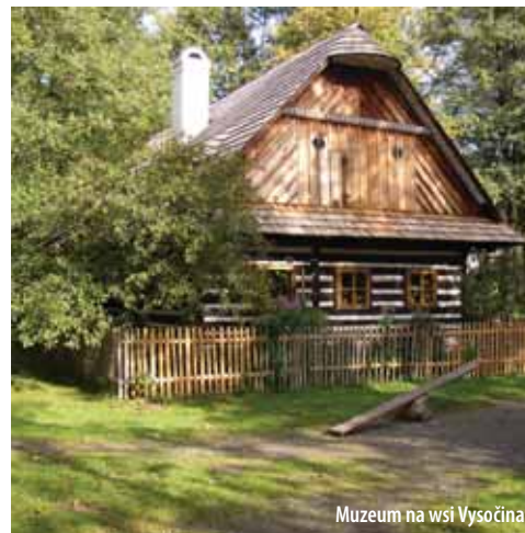
Muzeum na wsi Vysočina

Znajduje się w krainie Czeskiego Średniogórza. Tworzy je zbiór cennej architektury ludowej, w której stoją obok siebie budowle zarówno drewniane, budynki z muru pruskiego i murowane. W kilku obiektach prezentowane są ekspozycje wewnętrzne i zewnętrzne - Gospodarstwo rolne nr 61, Sklep Wiejski, Szkoła Wiejska, Młyn Wodny i kościół św. Marii Magdaleny. Jest też stacja kolejowa Zubrnice.