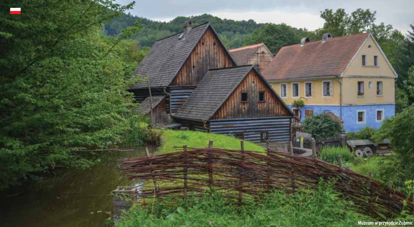
Muzeum w przyrodzie Zubrnice