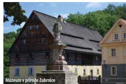
Múzeum v prírode Zubrnice