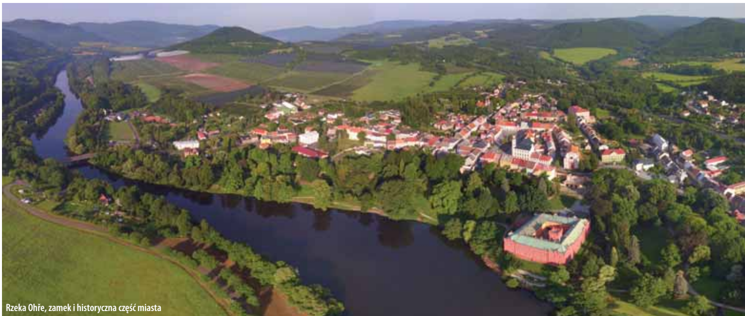
Rzeka Ohře, zamek i historyczna część miasta