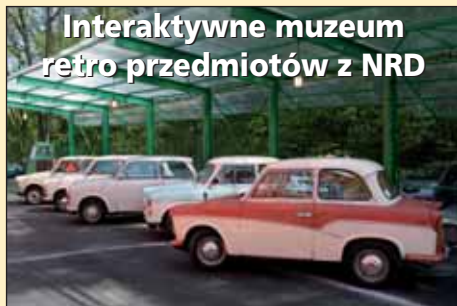
Interaktywne muzeum retro przedmiotów z NRD

Kompletną historię produkcji marki samochodów Trabant, od pierwszego praprzodka Trabantu AWZ - P70 (1954), poprzez Trabant P 60 (600), Trabant 601 najczęstszą i najbardziej znaną wersję, aż po najnowszy czterosurowego Trabant 1,1 z silnikiem pochodzącym z VW POLO (1989 - 1991), z którym produkcja tych pojazdów w 1991 roku została zakończona. Wszystkie te samochody są wystawiane i prezentowane w pierwotnym, zachowanym stanie.