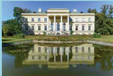
Neues Schloss Kostelec nad Orlicí