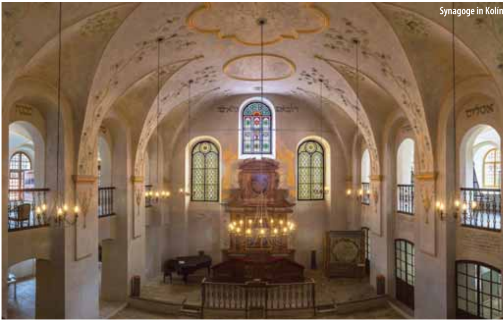
Synagoge in Kolín