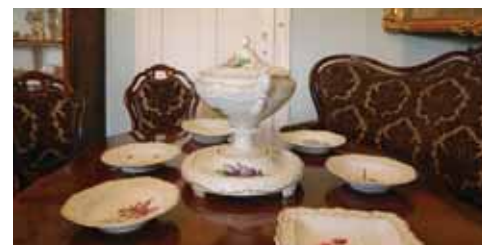
Porzellan von Klášterec nad Ohří

Turistické informační centrum Klášterec nad Ohří Nám. Dr. E. Beneše 85, 431 51 Klášterec nad Ohří Tel.: +420 474 359 687, E-mail: icklasterec@muklasterec.cz www.klasterec.cz