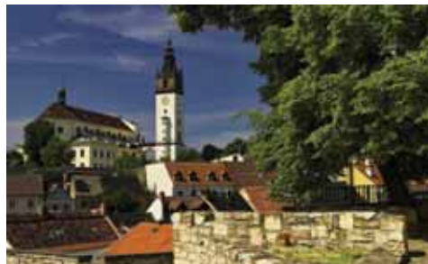
St.-Stephans-Dom mit Turm

gehören romanische Statuen der Evangelisten aus Žitenice oder Bild des Heiligen Einsiedlers Antonius von Lucas Cranach dem Älteren. Der Rundgang setzt vom Museum in die Nordböhmisches Galerie der bildenden Kunst fort. In ihren Dauerausstellungen finden Sie mittelalterliche und barocke Sakralkunst aus der hiesigen Region. Weiter besuchen Sie den Domplatz. Da steht der Stephansdom, der das markanteste Wahrzeichen der ganzen Stadt darstellt. Er stammt aus dem 17. Jahrhundert. In seiner Nähe steht der Domaussichtsturm, der in den