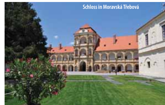
Schloss in Moravská Třebová

Es ist ein Ausflug mit der Suche nach der Schönheit der Edelpferde und auch der Geschichte der fürstlichen Familie der Auersperger, die hier bis zum Jahr 1942 lebte. Einzigartige technische Lösung des Bades, Wasserklosetts, Elektrizitätsverteilung, Küche mit Geschirrwaschraum oder Schlossheizungsraum übertrafen ihre Zeit.