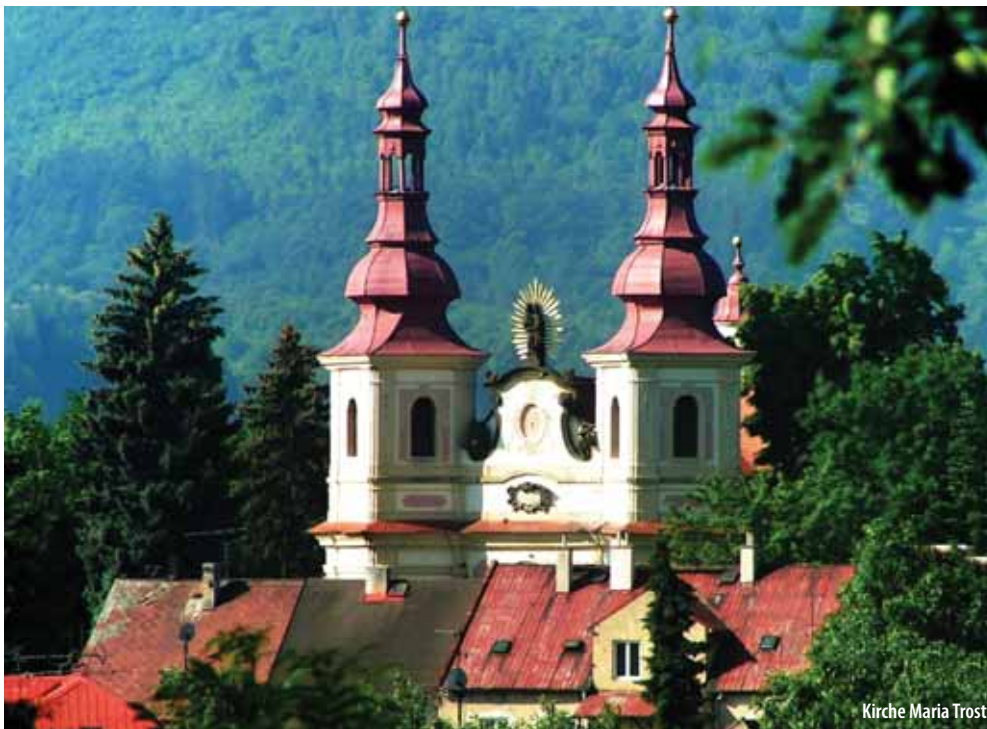
Kirche Maria Trost