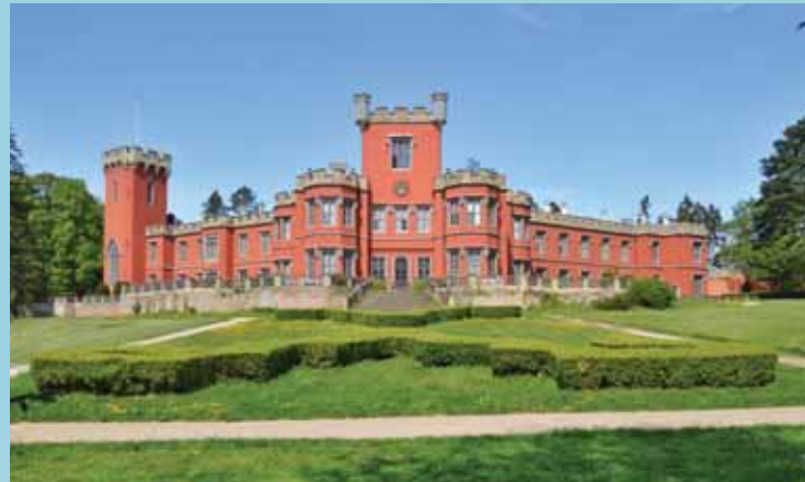
Schloss Hrádek u Nechanic