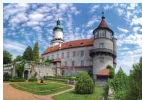
Schloss Nové Město nad Metují