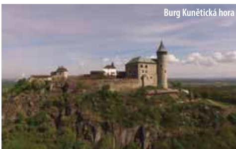
Burg Kunětická hora

Das Objekt gehört zu den ältesten steinernen Burgen Tschechiens. Die von Legenden umwittelte Burg wurde im 13. Jahrhundert gegründet. Während des Besuchs erfahren Sie nicht nur ihre Geschichte, sondern auch ihr furchtbares Geheimnis.