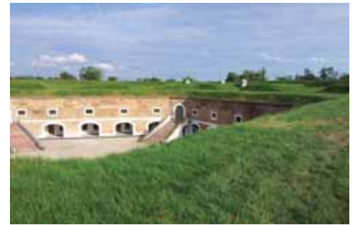
Erneuerter Innentrakt der Festung

Den mächtigen Stützpunkt zwischen Prag und Norden zu errichten. Der Feind konnte sich nicht leisten, so große Garnison umzugehen und sie in eigenem Hinterland zu lassen. Die geplante Personenzahl wurde nie vollgefüllt. Was kann man hier sehen?