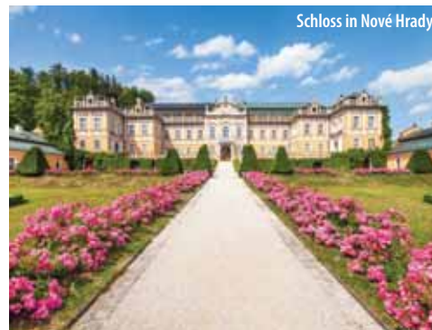
Schloss in Nové Hradky