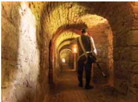
Unterirdische Minengänge der Festung Terezín

Am Zusammenfluss der Eger und Elbe, nicht weit vom historischen Litoměřice, erstreckt sich stets ein raffiniertes System der Verteidigung, Rarität und auch Weltunikat – josephinische Festungsstadt Terezín. Die Festung wurde vom Kaiser Joseph II. im Jahr 1780 gegründet. Ihre Aufgabe war die Verteidigung der tschechischen Grenze gegen die Angriffe vom Norden. Die damalige Genialität und das strategische Denken der Baumeister trugen zur Entstehung der Festung bei, die den Höhepunkt der europäischen Bastion-Festungsbaukunst darstellt.