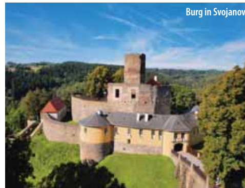
Burg in Svojanov

Auch dieses Schloss ist von europäischer Bedeutung. Der Herrnsitz ist seltenes Beispiel des architektonischen Übergangs eines Burgbaus in eine Schlossanlage. Sie finden hier nicht nur bemerkenswerte Wandmalereien und geheimnisvolle Kapelle Drei Könige, sondern auch Sammlungen des Ostböhmisches Museums und der Ostböhmisches Galerie.