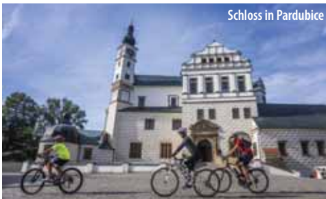
Schloss in Pardubice

Der größte Drache in den tschechischen Ländern soll hier weilen. Die Burg ist auf jeden Fall das oft besuchte Denkmal im ostböhmisches Elbetal. Regelmäßige Theatervorstellungen, Konzerte oder Musikfestivals werden in der Burg und auch in der Vorburg veranstaltet.