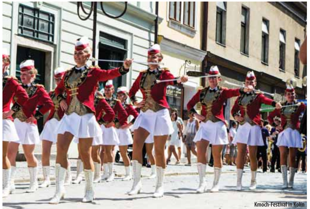
Kmoch-Festival in Kolín

Tourist – Info Kolín Na Hradbách 157, 280 02, Kolín I Tel.: +420 321 712 021; Handy: +420 774 138 197 E-mail: mic@mukolin.cz www.infocentrum-kolin.cz