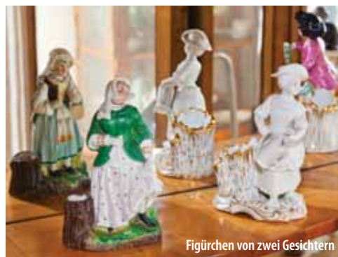
Figürchen von zwei Gesichtern