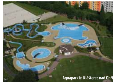
Aquapark in Klášterec nad Ohří