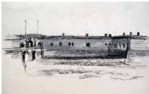
Ema Blažková – Drawing from the Small Fortress Terezín

Kladno occupied the lyceum building in Roudnice and arrested 84 students. The pretexts for the action were alleged preparations to assassinate Alfred Bauer, a teacher of the German elementary school in Roudnice and a Gestapo informer. The arrested students, among them Ema Blažková and sixteen girls from the seventh form A, were transported for interrogation in the Small Fortress in Terezín. The girls served as cleaning workers, the young men were taken to work outside the Small Fortress. She was released from Terezín, where two of the imprisoned students perished, only on November 2, 1942.