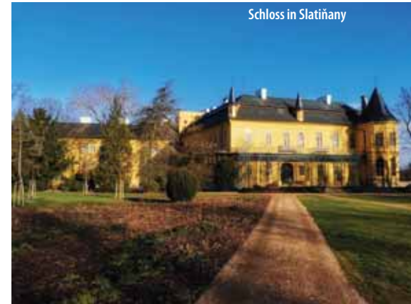
Schloss in Slatiňany

Es wird tschechisches Versailles oder kleines Schönbrunn zubenannt. Und wirklich, es ist ein echtes Rokoko-Unikat der Region von Pardubice. Der im Jahr 1777 errichtete Bau hat bis heute seine eigenartige architektonische Gestalt. Der Bestandteil des Besuchs ist das Erste tschechische Museum für Radsport, Galerie der englischen Hüte oder Gehege mit frei lebenden Hirschen und Damhirschen.