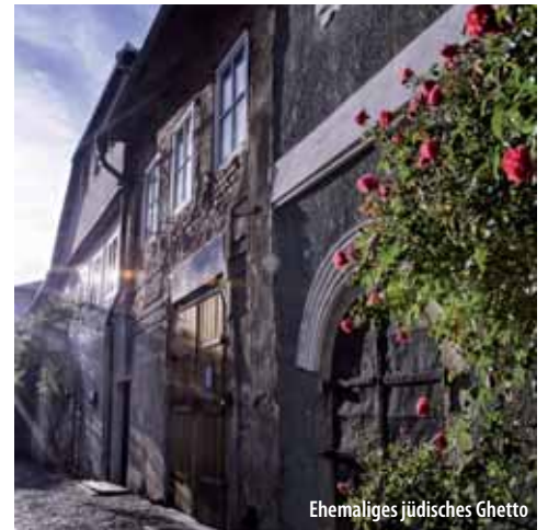
Ehemaliges jüdisches Ghetto

Im Durchgang des Gebäudes der ehemaligen jüdischen Schule (heute findet man hier Touristeninformation) entdecken Sie eine der ältesten und wertvollsten Synagogen Böhmens. Sie diente ihrem Zweck mit einigen Beschränkungen bis zum Untergang der jüdischen Gemeinde in Kolín im Jahr 1953. Auf dem ursprünglichen Ort wurde der