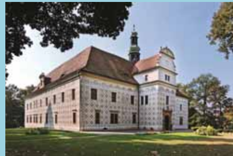
Schloss Doudleby nad Orlicí