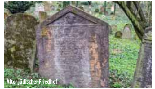
Alter jüdischer Friedhof

frühbarocke Toraschrein (Aron ha-Qodesch) aus dem Jahr 1696 erhalten, einstiger Bestandteil der Synagoge.