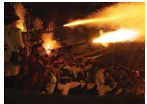
Nachtschießen während der Feste

Die wirklich außergewöhnlichen historischen Rekonstruktionen sind eine echte touristische Merkwürdigkeit. Zum Beispiel die im Sommer stattfindenden Letzten Piratenkriege mit Segelschiffen, die in den Wassergräben schwimmen, und dann in Europa ganz einmalige Josephinische Feier (erstes Oktoberwochenende). Diese großzügige Militärrekonstruktion hat ihr Gegenstück nirgends in der Welt und sie lockt alle Fans aus ganzem Kontinent.