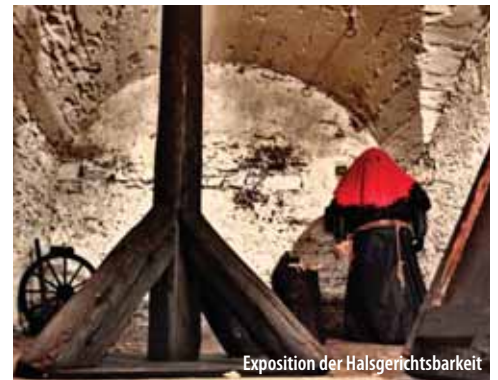
Exposition der Halsgerichtsbarkeit

Eintrittspreis: : Ab 1. 4. 2020 voller Preis 80,- CZK, ermäßigter Preis 50,- CZK, Kinder bis 3 Jahre kostenlos, Führung in der Fremdsprache – voller Preis 100,- CZK, ermäßigter Preis 80,- CZK