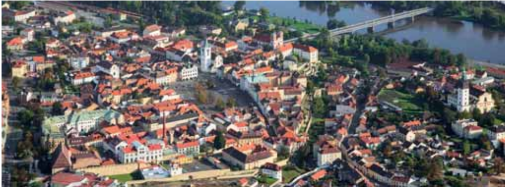
Stadt und Tyrš-Brücke