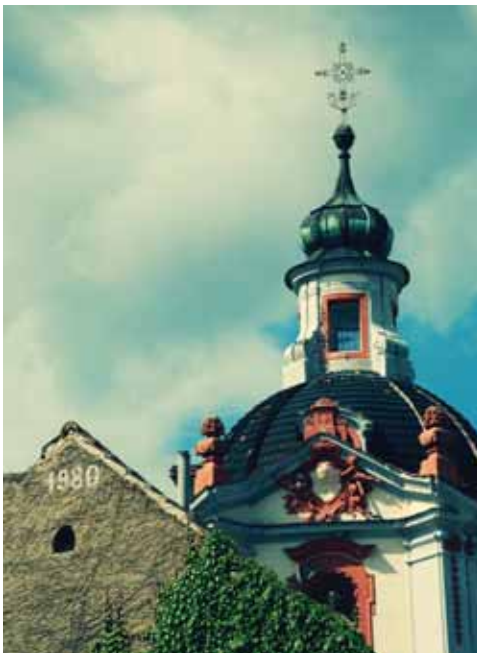
Kirche von St. Wenzel