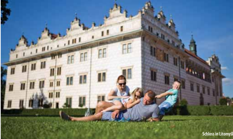
Schloss in Litomyšl