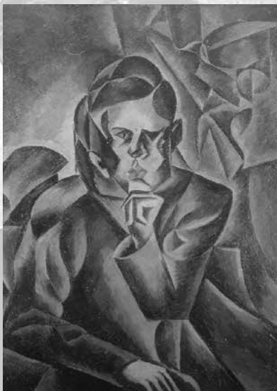
Podoba Jana Zrzavého (Bohumil Kubišta, 1912)