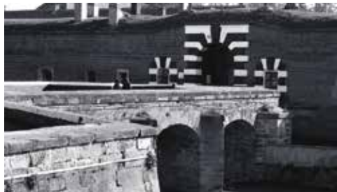
Malá pevnost Terezín