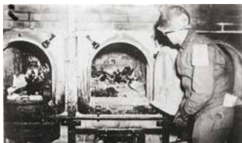
Buchenwald, 16. apríl 1945