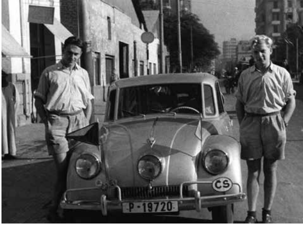
Tatra 87, zľava Jiří Hanzelka, Miroslav Zikmund

Na Štedrý deň roku 1920 sa v dome na kopci Kotouč pri Štramberku narodil český spisovateľ, cestovateľ a publicista Jiří Hanzelka. Je neodmysliteľne spojený s Miroslavom Zikmundom, s ktorým absolvoval priekopnícke cesty do Afriky a Južnej Ameriky.