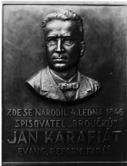
Tablica pamiątkowa na domu rodzinnym, odsłonięta w 1936 roku

„I nadeszła jesień. Światła ubywało, zimy przybywało, świetliki już nigdzie nie polecą. Zaprosili tylko jeszcze świetliki z chruśniaka.” Kto by nie znał poetycznego opowiadania o Świetlikach z naszej najbardziej znanej książki dla dzieci Jana Karafiáta, które czytały nam mamy przed snem.