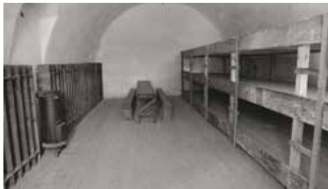
Jedna z ciev v Malej pevnosti