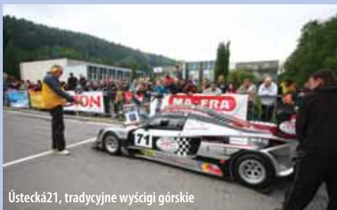
Ústecká21, tradycyjne wyścigi górskie

Wędrówki po okolicy Ústí nad Orlicí można połączyć z wzięciem udziału w jednej z wiosennych imprez. Oto nasze zaproszenie: