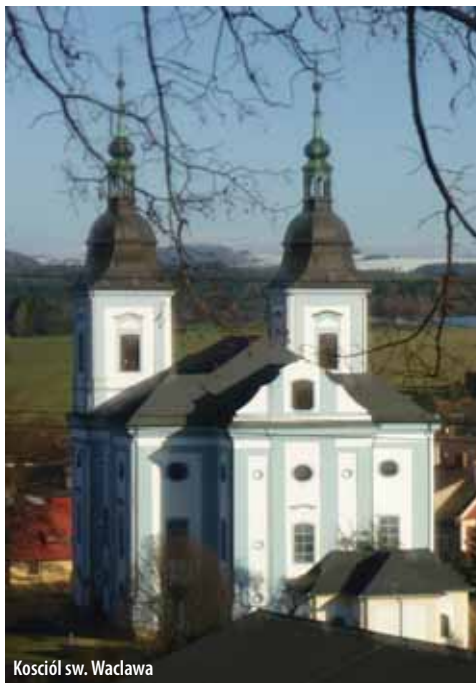
Kościół św. Wacława

Do najpopularniejszych miejsc można zaliczyć wieżę widokową Tyršova, kościół św. Wacława z nowymi dzwonami, muzeum miejskie, rozległy park zamkowy, jak również miejscowy browar, w którym można skosztować piwa Žamberecký Kanec. Žamberk to sympatyczne miejsce, idealne na aktywny wypoczynek lub weekend na łonie natury z dobrym zapleczem w postaci tras turystycznych i rowerowych. W Dzikiej Orlicy lub w pobliskim zbiorniku wodnym Pastvinská přehrada można łowić ryby, możliwość jazdy konnej oferują Žamberk lub Kunvald. Žamberk przeistacza się w zimie w dobrą bazę wypadową na narty do Dlouhoňovic, Českých Petrovic, Čenkovic, Červeney Vody lub w Říček w Górach Orlickich. Zapraszamy do Žamberka, miasteczka u podnóża gór Orlickich, gdzie czeka na Państwa zarówno spokój i relaks, jak i możliwość aktywnego odpoczynku.