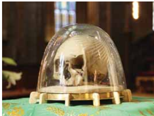
Czaszka św. Wojciecha w Katedrze św. Wita