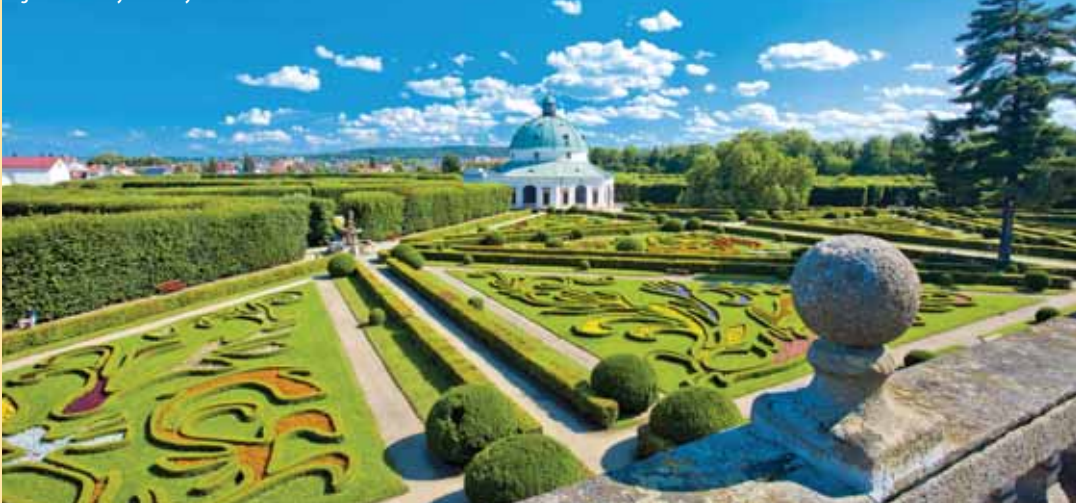
Ogród kwiatowy Kromieryz

W mieście wojewódzkim Zlín można zobaczyć jeden z najpiękniejszych ogrodów zoologicznych nie tylko w Republice Czeskiej. Odwiedzający, których przybywa z roku na rok, doceniają ekspozycje zwierząt, uporządkowane według kontynentów, autentycznego środowiska, ekspozycje, przez które można przechodzić oraz minimum barier oddzielających zwierzęta i ludzi. Wyjątkowa na skalę europejską jest Zatoka Płasczek, gdzie te chrześnoszkieletowe okazy odwiedzający może nie tylko zobaczyć ale także pogłaskać lub nakarmić. Przepiękny i wyjątkowy jest jednak sam Zlín. Funkcjonalistyczna architektura wyodrębnia miasto na tle wszystkich pozostałych. Zlínský drapacz chmur, budynek nr 21 z unikatowym biurem szefa w windzie, ekspozycja multimedialna „Princip Bata”, gale-