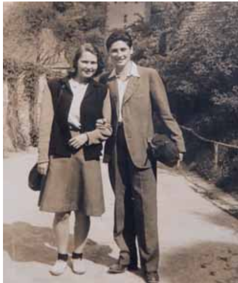
Viera a Vilda na Karlstejne (1946)