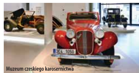
Muzeum czeskiego karosernictwa