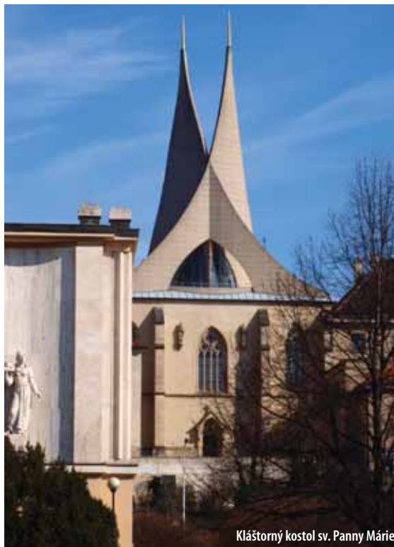
Kláštorný kostol sv. Panny Márie