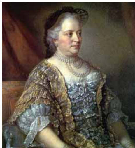
Portret Marii Teresy Habsburg (1762), Jean-Etienne Liotard

Maria Teresa Valpurga Amalia Krystyna Habsburg (13.05.1717–29.11.1780) , najstarsza córka Cesarza Karola VI i Elżbiety von Braunschweig-Wolfenbüttel, była jedyną kobietą, władającą na czeskim tronie. Arcyksiężną Austrii, Królową Węgier (1740–1780) i Czech (1743–1780), Margrabia Moraw co prawda odziedziczyła po ojcu te i dalszych 17 tytułów, które jednak musiała sobie dać kolejno potwierdzić.