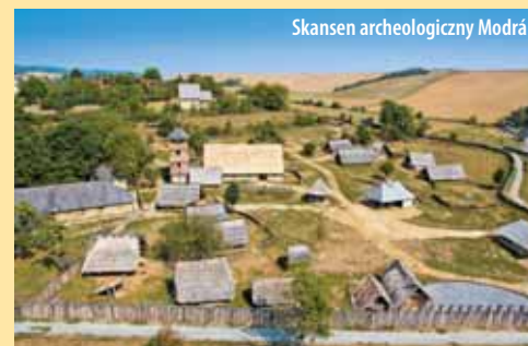
Skansen archeologiczny Modrá

Morawy Wschodnie należą także do regionów o bogatej ofercie z zakresu turystyki rowerowej. Dwie główne ścieżki rowerowe – wzdłuż Kanału Baty i rzeki Bečvy – przecinają cały kraj od północy na południe i są tym najlepszym, co można w no-