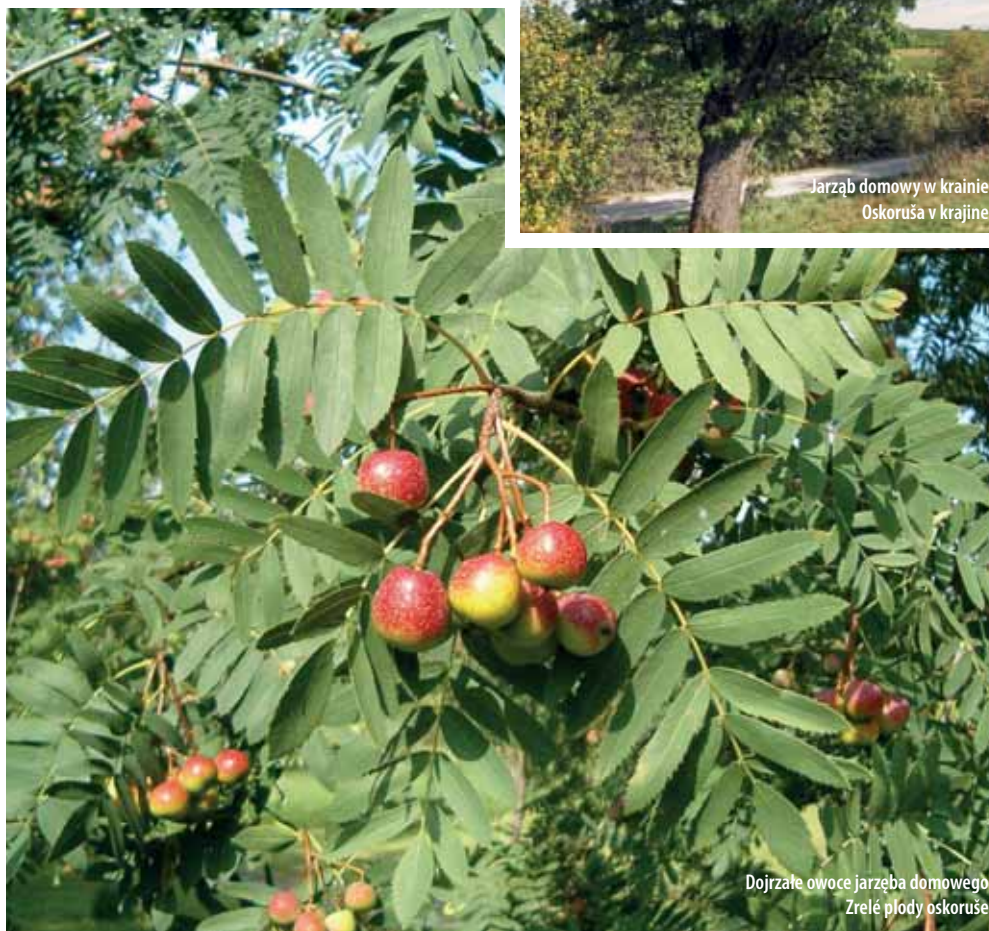
Dojrzałe owoce jarzęba domowego Zrelé plody oskoruše