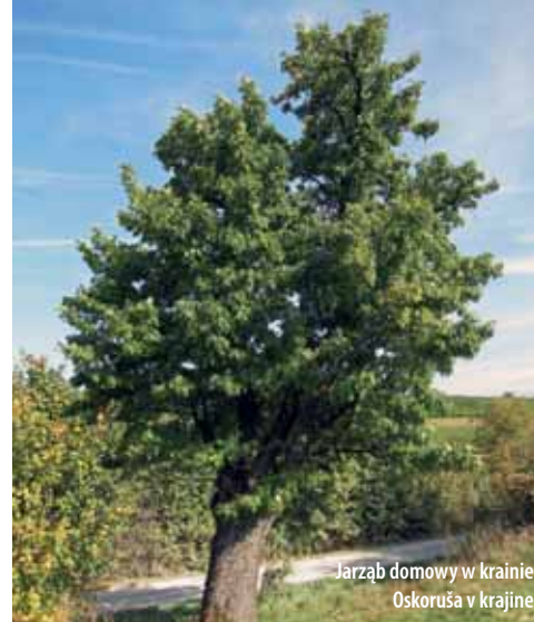
Jarząb domowy w krajinie Oskoruša v krajine