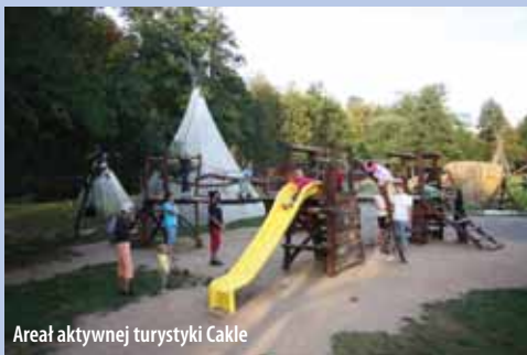
Areał aktywnej turystyki Cakle