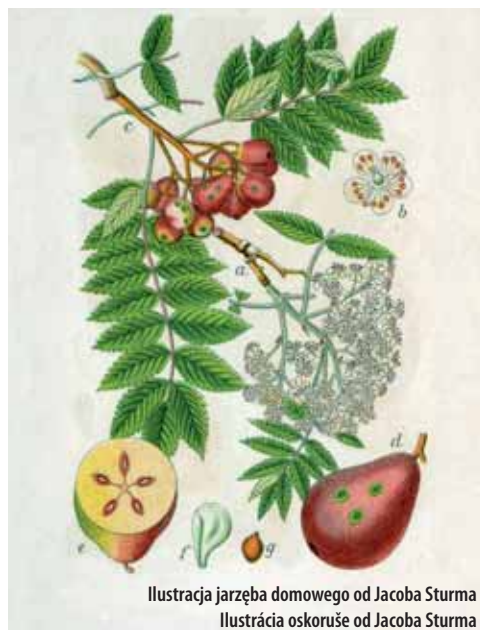
Ilustracja jarzęba domowego od Jacoba Sturma Ilustracja oskoruše od Jacoba Sturma

Dżem jest znakomity ze świeżym pieczywem lub jako dodatek do sosów mięsnych, smacznego!