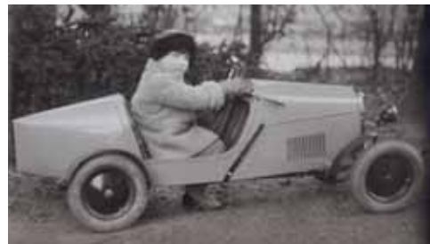
Viera asi v roku 1932