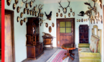
▲ Lovecký salónek