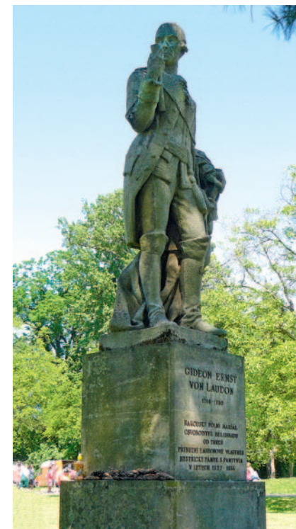
▲ Socha generála Loudona

V roce 1933 se Loudonové dostali do finančních potíží a zámek přešel do majetku státu. Ministerstvo obrany v něm zřídilo vojenské sklady zdravotnického materiálu. Ty byly na zámku, s přestávkou za 2. světové války, až do roku 1990. Od roku 1991 patří zámek městu a postupně se opravuje. Zámecký park vlastní Armáda ČR, je zde umístěno Centrum zdravotnického materiálu.