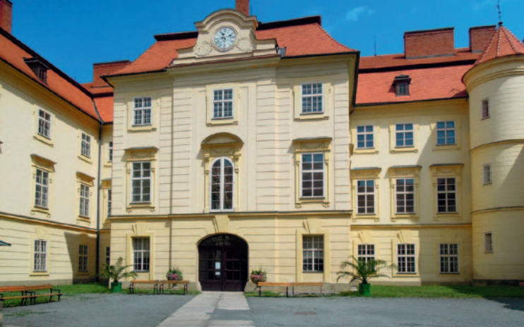
▲ Grimmův palác s klozetovou věží

Zámek v Bystřici pod Hostýnem je zajímavou ukázkou různých stavebních stylů. Gotická tvrz je poprvé dokládána roku 1440, mnoho se z ní ale nedochovalo. V polovině 16. století koupil panství Přemek z Víckova, který pravděpodobně přestavěl tvrz na renesanční zámek. Požárem zničený zámek zdědila a v renesančním stylu nechala přestavět v roce 1616 Bohunka z Víckova se svým manželem Václavem Bítovským z Bítova.