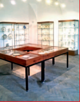
▲ Keramika na šlechtických dvorech