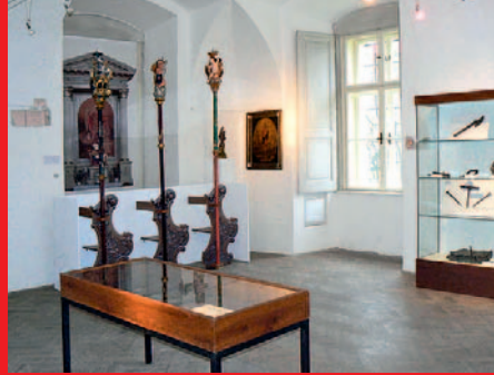
▲ Bystřické cechy