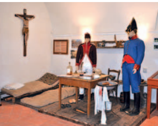
▲ Vojenský špitál