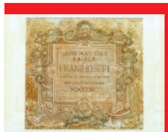
▲ Pamětní nápis