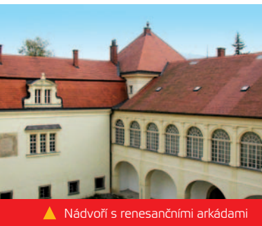
▲ Nádvoří s renesančními arkádami

Od roku 1650 patřil zámek šlechtickému rodu Rottalů. Poslední členka rodu Marie Amálie, provdaná della Rovere di Monte l'Abbate, nechala přistavět v klasicistním stylu dvě křídla, která navazovala na části starého zámku. Nový zámecký palác vytvořil architekt František Antonín Grimm ve 2. polovině 18. století.