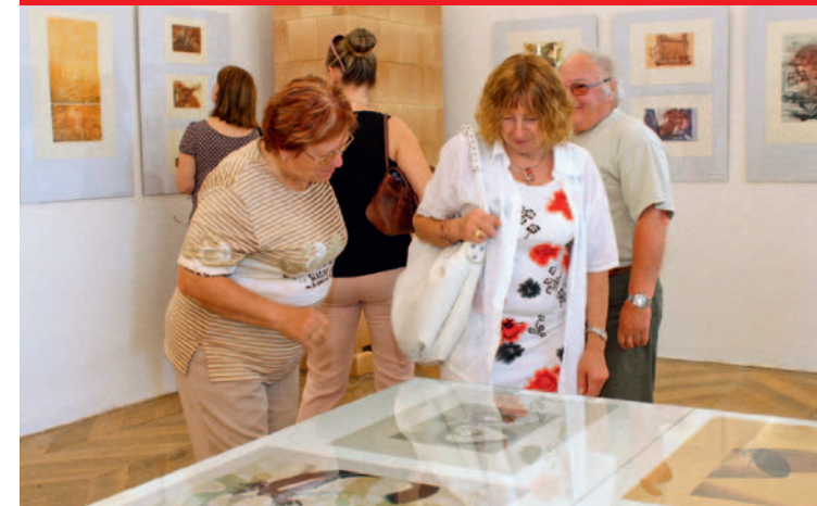
▼ Výstavní sály

Zámecký park byl považován v 19. století za jeden z nejkrásnějších parků na Moravě. Loudonové prosluli především jako botanici, pěstovali okrasné dřeviny i růže. Vybudovali zimní zahradu s vytápěnými skleníky, ve kterých pěstovali lekníny z rodu Victoria regia, orchideje a další exotické rostliny. Za pozoruhodný považovali soudobí návštěvníci také skleník na ananas.