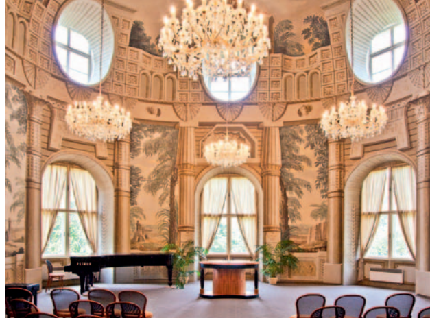
▲ Sváteční sál

Koncem 18. století byla v přízemí zámku zřízena manufaktura na výrobu keramiky. Poslední stavební úpravou byla přístavba tzv. klozetové věže v roce 1889.