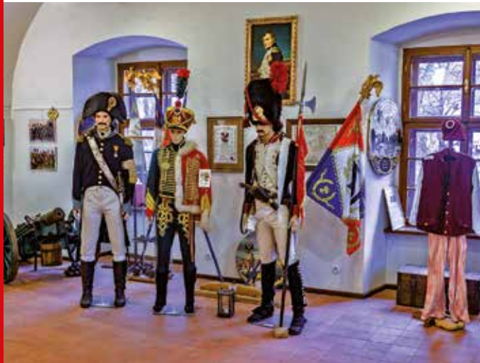
Expozice napoleonských vojáků

Napoleonská expozice je věnována období napoleonských válek – dobové materiály, uniformy a zbraně, nálezy ze slavkovského bojiště, ukázka práce vojenského chirurga.