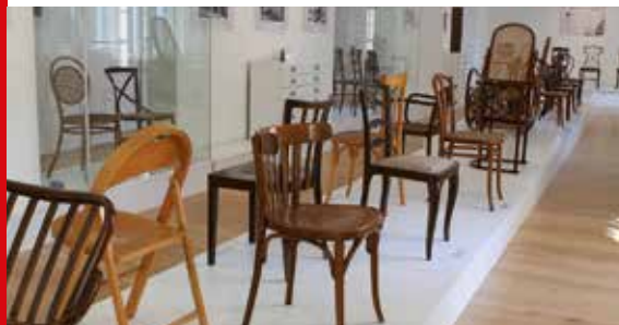
Expozice Historický ohýbaný nábytek

Expozice ohýbaného nábytku značek Thonet, Kohn, Fischel a Mundus představuje přehled o výrobě ohýbaného nábytku od 2. poloviny 19. století až do 1. poloviny 20. století. Jde o výběr nejzajímavějších kusů nábytku ze sbírek firmy TON, a. s., a Městského muzea v Bystřici pod Hostýnem.