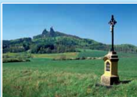
8. Hrad Trosky – symbol Českého ráje