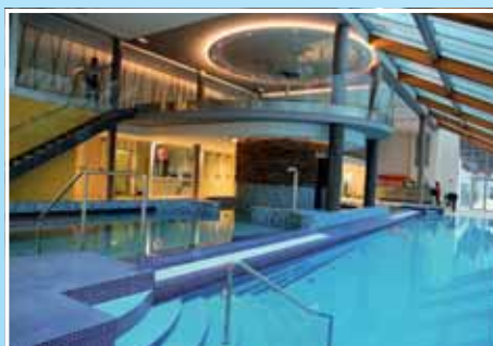
7. Termální bazény Wellness Horal