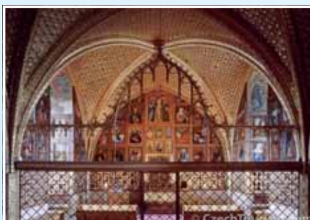
3. Karlštejn – za mistrem Theodorikem i Otcem vlasti