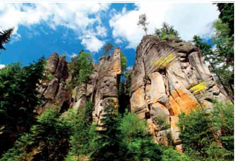
1. Skalní město u Adršpachu

Do soutěže internetového portálu Kudy z nudy o nejoblíbenější turistickou nabídku pro rok 2011 se zapojilo 11 tisíc lidí, kteří rozdělili téměř 100 tisíc hlasů. První místo si podle návštěvníků portálu zaslouží skalní město u Adršpachu. Také na druhém místě skončila přírodní památka – vyhlídka Belvédér v Českém Švýcarsku. Pomyslnou bronzovou medaili hlasující udělili hradu Karlštejn.