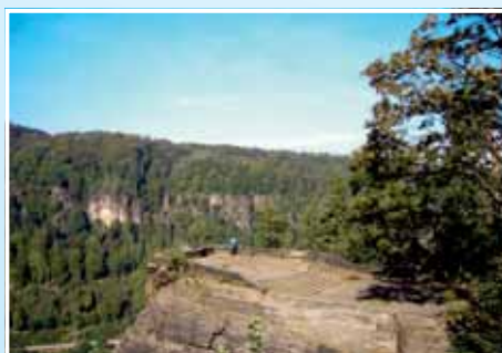
2. Belvédér – nejhezčí vyhlídka na České Švýcarsko

V Cenách Kudy z nudy bojovaly turistické cíle o prvenství ve třech kategoriích (tradiční cíl, novinka sezony a podnikatelský počín) a dále pak v jednotlivých regionech. Soutěž měla dvě kola. V její neveřejné části vybrali z katalogu Kudy z nudy odborníci v cestovním ruchu reprezentativní desítku nabídek pro každý ze 17 turistických regionů. Pro ty mohla hlasovat veřejnost od 20. 6. do 30. 9. a čtenáři mohli do hlasování doplnit také své tipy.