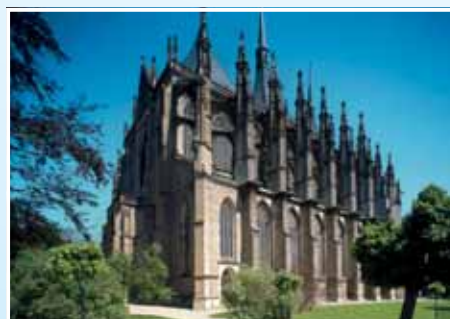
4. Chrám sv. Barbory v Kutné Hoře