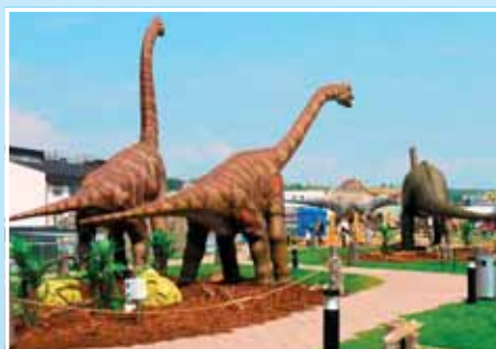
5. DinoPark Harfa Praha