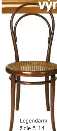
Legendární židle č. 14

▲ Někdejší Thonetova vila byla postavena mezi lety 1873-1877 v Přerovské ulici jako obytný dům pro rodinu továrníka Michaela Thoneta. Dnes je ve vile umístěna moderní prodejní expozice firmy TON a.s.