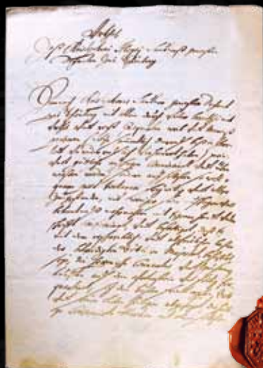
Rozsudek smrti nad děkanem Lautnerem, pečeť inkvizitora Bobliga