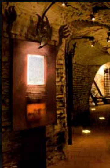
Foto z expozice