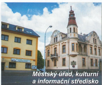
Městský úřad, kulturní a informační středisko

Středem města je náměstí, kde je současný městský úřad, kulturní a informační středisko. Na druhé straně náměstí pak městská knihovna, výstavní sál a muzeum Královského hvozdu, které se nacházejí v barokním domě, který v 17. století sloužil jako panský hostinec. Na náměstí navazuje pěší zóna, která lemuje pravý břeh řeky Úhlavy, na jejímž konci uvidíme budovy známého podniku "Okula". Když před branami tohoto podniku přejdeme most, dostaneme se na levý břeh řeky Úhlavy. Po tomto běhu pokračujeme proti proudu, dojdeme k tenisovým kurtům, nově zrekonstruovanému letnímu koupališti se slanou vodou a kempu. Po dalších pár krocích podél řeky se před námi otevře prostor sportovního areálu pod sjezdovkou, který je vybaven dětským hřištěm, hřištěm pro malou kopanou, workoutem, in-line dráhou s okruhem dlouhým 1270 metrů a je zde možné se i občerstvit. Za dobrých zimních podmínek můžete v našem městečku navštívit také sjezdovku, která se nachází právě hned u sportovního areálu. V tomto koutku se nachází ještě jedna významnost našeho města, a to je lesní divadlo, kde se od jara do podzimu pořádají ochotnická divadelní představení a v letních měsících slouží také jako letní kino. Když se hned za lesním divadlem ponoříme do lesa, značená turistická cesta nás dovede až k zřícenině hradu Pajrek.