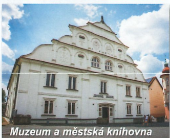
Muzeum a městská knihovna