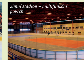
Zimní stadion – multifunkční povrch