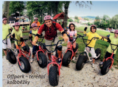
Offpark – terénní koloběžky