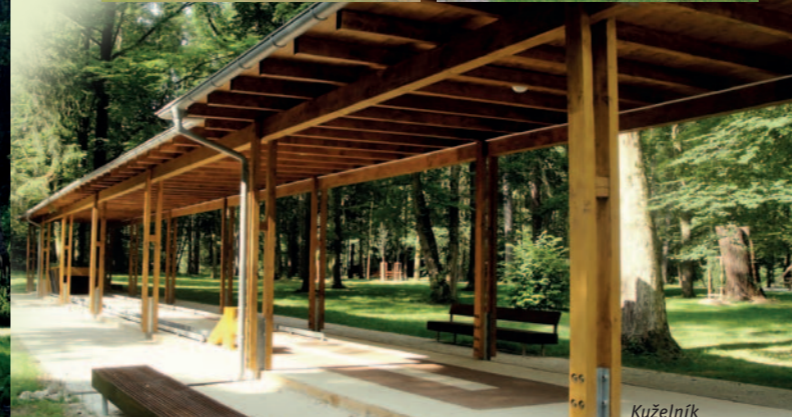
Kuželník na Santosu