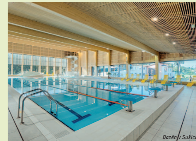
Bazén v Sušici

Bazénová hala nabízí návštěvníkům areálu několik jedinečností. V první řadě je to tobogán se světelnými a zvukovými efekty a časomírou , díky které si můžete porovnat čas a s přáteli si uspořádat malé závody. Samostatný, 25 m dlouhý plavecký bazén nabízí vždy vyhrazené dráhy pro kondiční plavání a ve vymezených časech je spouštěna simulace říčního proudění , která nemá v Evropě obdoby. Děti se za každého počasí mohou vydávat v zábavním bazénu s divokou řekou nebo v brouzdališti a rodiče si mohou odpočinout v některé z vříivek . Relaxovat lze i ve finské sauně a tradiční parní lázni . V prostředí s netradiční