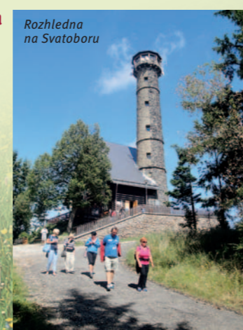
Rozhledna na Svatoboru