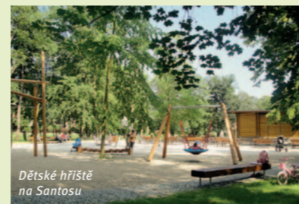
Dětské hřiště na Santosu

Ostrov Santos, který je součástí Luhu, leží mezi řekou Otavou a Mlýnským potokem. Městský lesopark, který se na ostrově nachází, prošel v letech 2012 – 2013 za podpory Nadace Proměny revitalizací. Velké moderní dětské hřiště jistě potěší především děti, zatímco rodiče mohou využít příjemného posezení s možností občerstvení . V blízkosti hřiště se nachází kuželník . Na jednom cípu ostrova naleznete „plovárnu“ s převlékárnou , na opačném