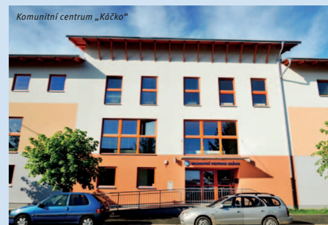
Komunitní centrum „Káčko“

Bylo postaveno v roce 2012. V budově se nachází Středisko volného času , multifunkční sál a venkovní amfiteátr , kde se pořádají různé společenské akce. Své zázemí zde našla také městská knihovna s čítárnou a veřejně přístupným internetem .