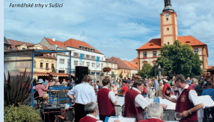
Farmářské trhy v Sušici

Milovníci kultury se v Sušici jistě nudit nebudou. Zajít mohou do kina nebo na nějakou pěknou výstavu. Zajímavých různorodých akcí se ve městě koná opravdu velké množství v průběhu celého roku.