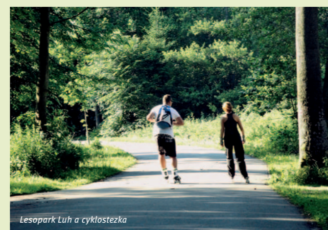
Lesopark Luh a cyklostezka

Oblíbená rekreační oblast bezprostředně sousedící s centrem města. Oblast, kde je možné od jara do podzimu rybařit, jezdit na kole i in-line bruslích, v létě se koupat a opalovat na březích řeky Otavy nebo městském koupališti, v zimě pak lyžovat na běžkách a celoročně relaxovat. Luhem také prochází dvě naučné stezky, Otavská cyklostezka a nachází se zde dvě velká dětská hřiště s dobrým zázemím.