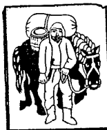
ZLATÁ STEZKA VIMPERK - PASSAU