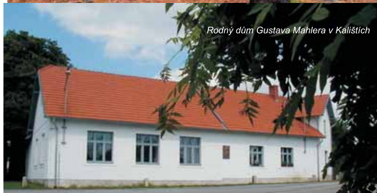
Rodný dům Gustava Mahlera v Kalištích

Jedna z nejnáročnějších ale zároveň nejkrásnějších tras. Váš dech zrychlí nejen prudší stoupání a adrenalinové klesání, ale především úchvatné výhledy do krajiny, civilizací nedotčená místa, romantická zákoutí i doteky dávné i nedávné minulosti. Uprostřed lesů na břehu vodního díla Švihov stojí kostel sv. Víta, jediný svědek toho, že zde ještě koncem minulého století stávalo dynamicky se rozvíjející městečko Zahrádka.