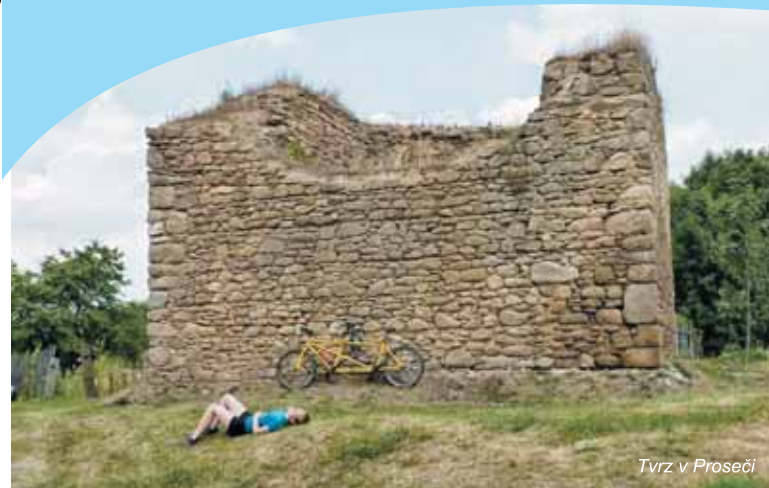
Tvrz v Proseči