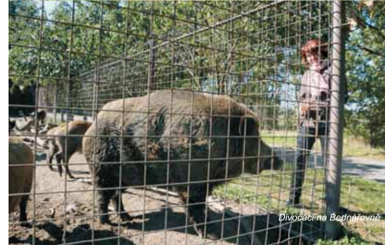
Divočáci na Bednářovně