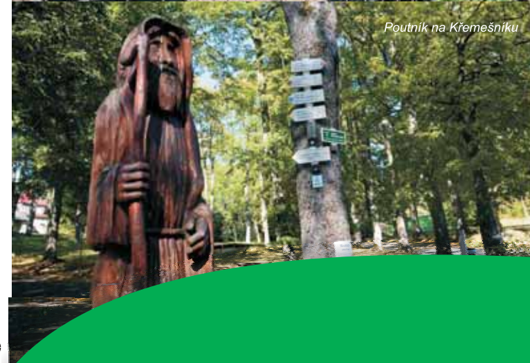
Poutník na Křemešniku

Tato trasa nadchne cykloturisty, kteří upřednostňují jízdu terénem a lesními cestami. Pojedete překrásným úsekem Českomoravské vrchoviny kolem bezpočtu potůčků, rybníků, tůňek a studánek, abyste vzápětí stanuli na nejvyšším vrcholu v okolí. Tato poněkud náročnější trasa je vedena pouze minimálně po silnicích, dá se však zvládnout i na trekovém kole.