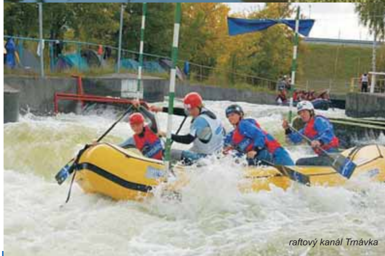
raftový kanál Trnávka