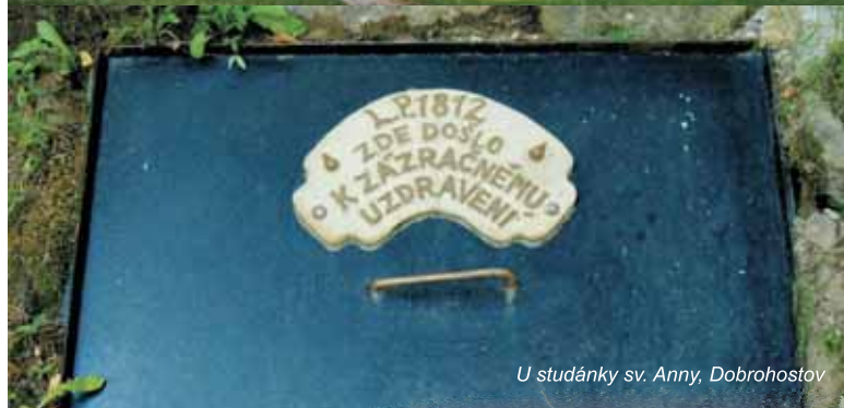
U studánky sv. Anny, Dobrohostov

Středně náročná trasa, na níž využijete hlavně horské kolo, ale dá se zvládnout i na trekovém. Čekají vás častá krátká stoupání a klesání, převážně lesními a polními cestami, ale i úzké silničky, které vás provedou útulnými vesničkami. Jako na Divokém západě si budete připadat v lesním westernovém městečku Stonetown, luxus ochutnáte v zámeckém komplexu Chateau Herálec a možná se dočkáte zázraku u malebné studánky sv. Anny u Dobrohostova.