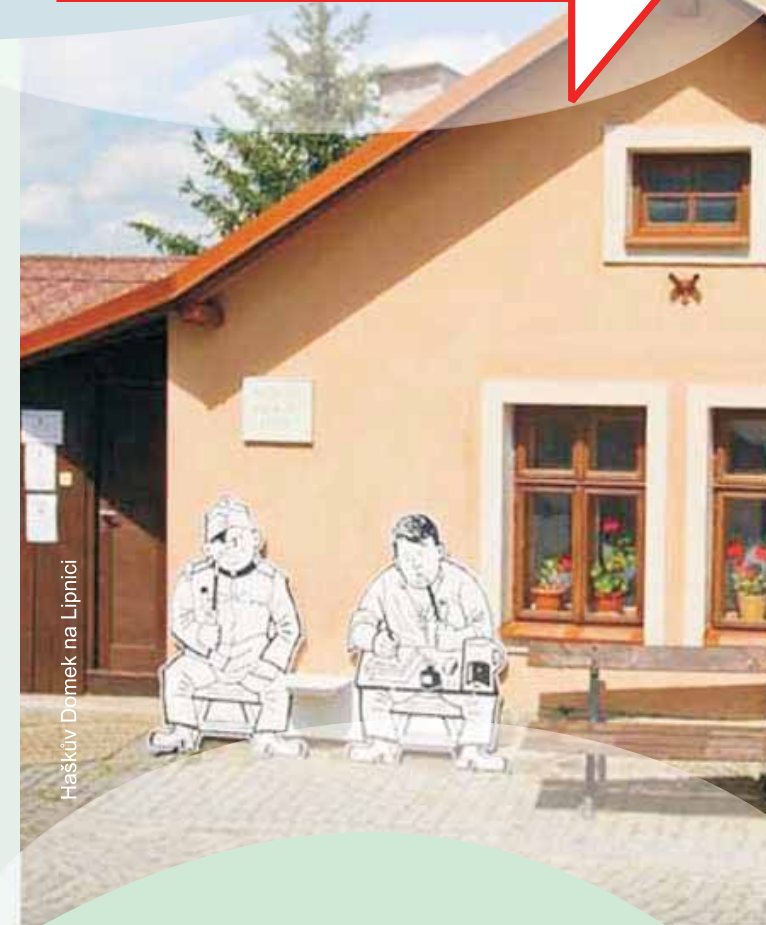
Haškov Domek na Lipnici