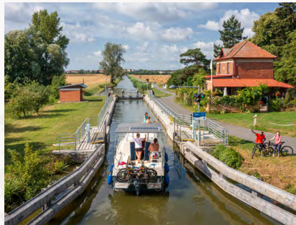
^ Baťův kanál nabízí spojení cyklistiky i plavby lodí