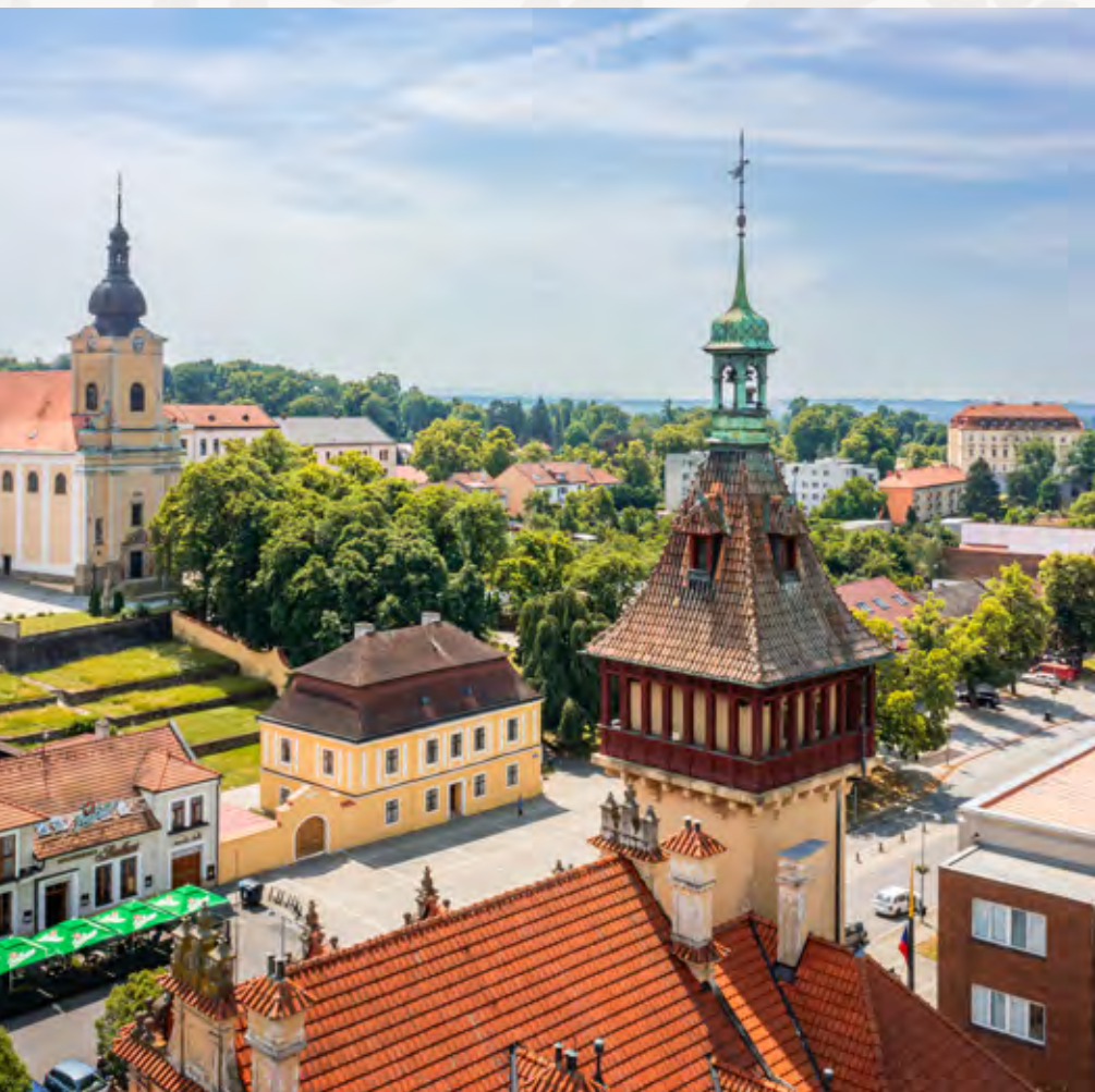
Pohled na Masarykovo náměstí – radniční věž, budova fary a kostel sv. Bartoloměje

V soutěsce, dnes označované jako Napajedelská brána, našli příznivé podmínky k životu již lidé doby kamenné. První písemná zpráva o tomto místě, kde býval významný brod přes řeku Moravu, pochází z roku 1362. Díky své strategické poloze pak Napajedla po staletí náležela ke starobylým dědičným panovnickým majetkům. Vlady nad jeho územím se dlouhodobě ujali Žerotínové, ale nejvýraznější stopu v historii panství zanechal rod Rottalů, který navýšil jeho rozlohu i význam. Právě jejich erb zdobí průčelí kostela sv. Bartoloměje i napajedelského barokního zámku.