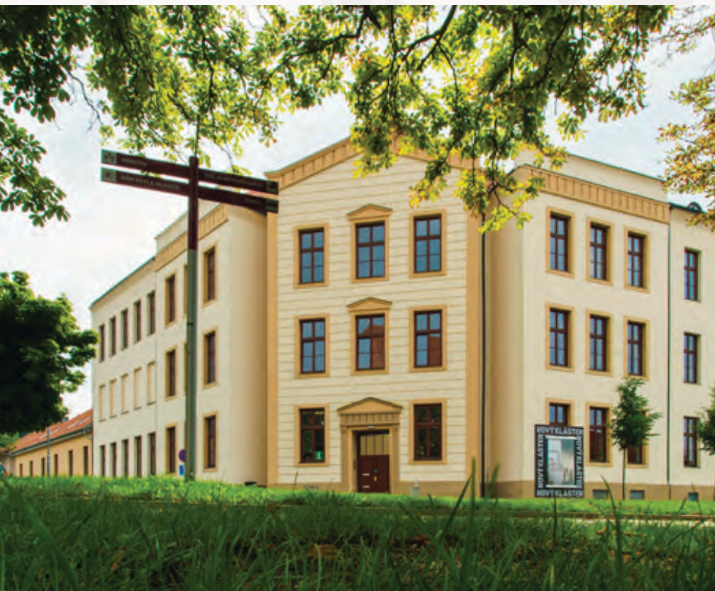
Nový Klášter – centrum a srdce kulturního života Napajedel ^

Více informací najdete na internetových stránkách: muzeum.napajedla.cz