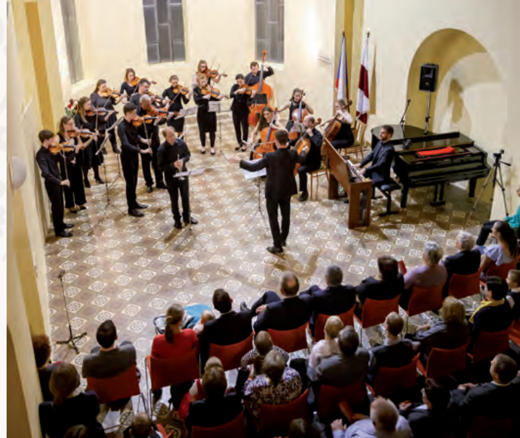
^ Kaple Nového Kláštera a Festival vážné hudby Pocta Rudolfo Firkušnému

V podzimních dnech skládá město Napajedla poctu svému slavnému rodákovi – klavíristovi světového významu Rudolfo Firkušnému. Virtuosovo jméno nese kvalitně obsazovaný festival vážné hudby, jehož tóny vždy v listopadu znějí pod klenbou pozoruhodné kaple, která je součástí napajedelského Nového Kláštera.