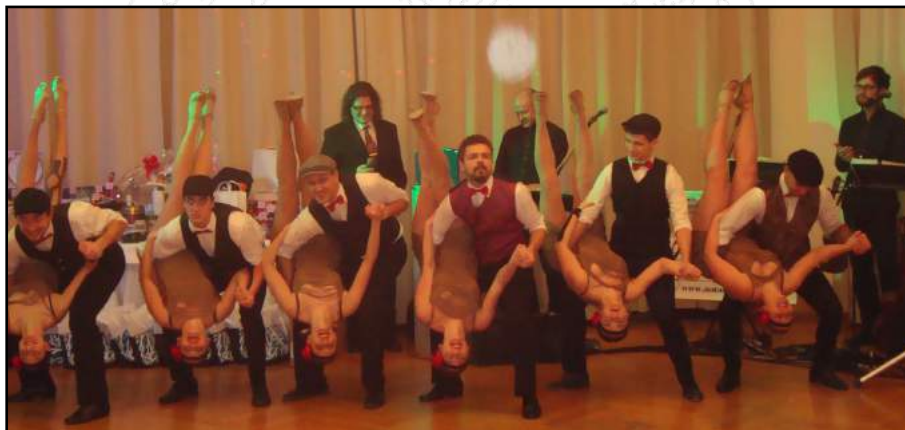
Taneční skupina Řečkovická 13 předvedla plesovým hostům, jak se to dělá.

Letošní krátká plesová sezona skončila ovšem ještě dříve, než pořádně začala. Již 10. února ji ukončily tradiční Ostatky, během nichž se dvacítka nadšenců, ponejvíce z divadelní společnosti Křový, převlékla do karnevalových úborů a vyrazila na obvyklou veselou pouť vesnicí, aby pozvala obyvatele do hostince u Farlíků, na večerní Pochovávání basy. Za starých časů se jim říkalo "maškarádi" a samozřejmě ani letos mezi nimi nechyběl nezbytný medvěd.