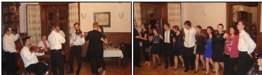
Horní patro plesového rejdiště opanovala cimbálová muzika Pecka. Hodová chasa ji využila k prvnímu neoficiálnímu nácviku na letošní hody.

Hned příští sobotu, 20. ledna, proběhl na Zámku Spolkový ples, který opět využil všechny tři zámecké sály.