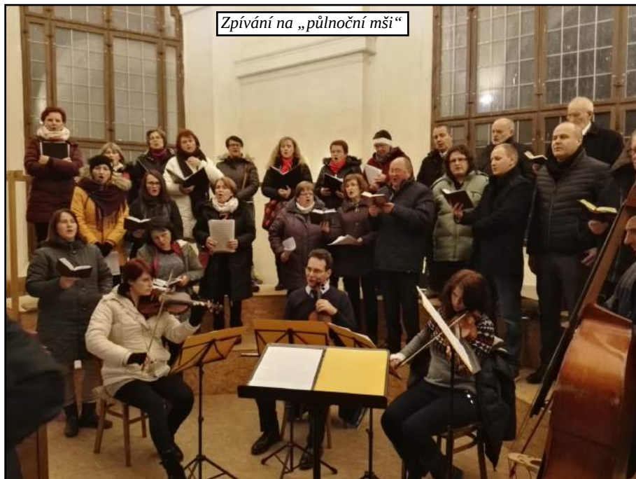
Zpívání na „půlnoční mši“