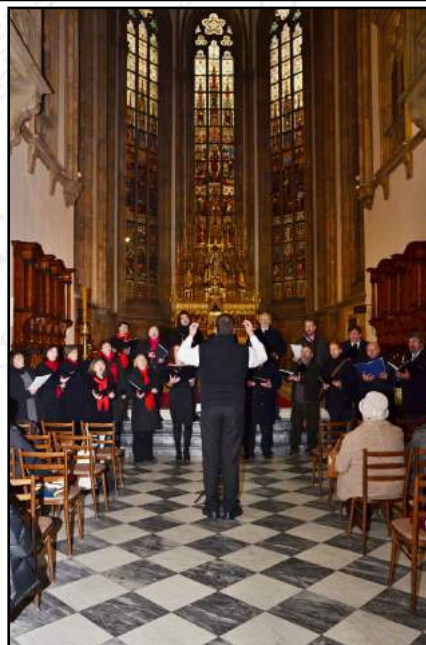
Svatocecilské setkání na Petrově