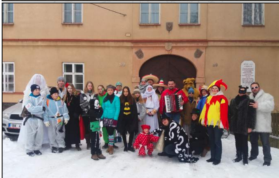
Ostatková chasa letos zapózovala, jako snad každý rok, před Farlíkovým a před Drápelovým.

Krátce před uzávěrkou Zpravodaje proběhl ještě v pátek 23. února na Zámku Společenský večer ŠLP, který spolu se Spolkovým plesem tvoří v současné době základ křtinského plesového dění.