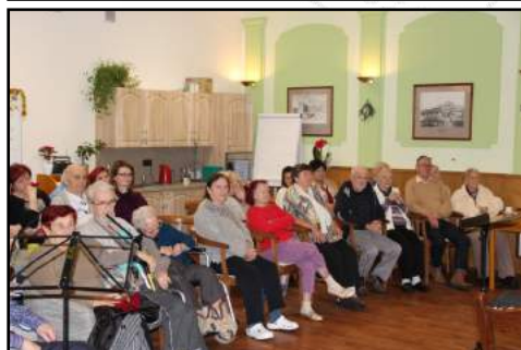
Koncert v Lumině