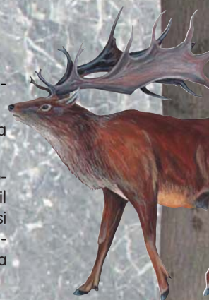
Sob polární ( Rangifer tarandus )