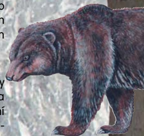
Medvěd jeskynní ( Ursus spelaeus )