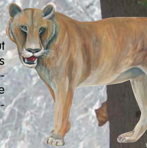
Lev jeskynní ( Panthera spelaea )

Vydalo statutární město Přerov v roce 2021 Grafické zpracování: Miloslav Flašar Tisk: EURO-PRINT