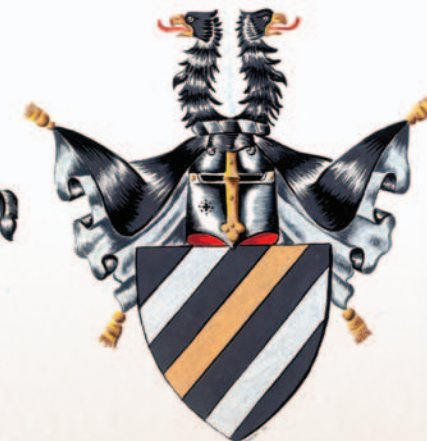
Škrbenští z Doloplaž