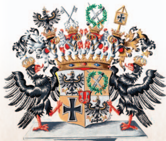
Blücher - Wahlstatt