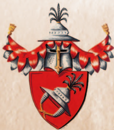
Puklicobé z Pozořic