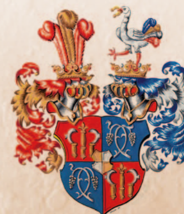
L arisch - M önnich