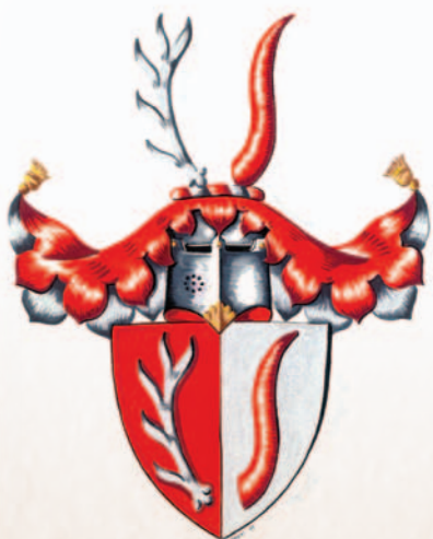
Čamborobé z Příbozu