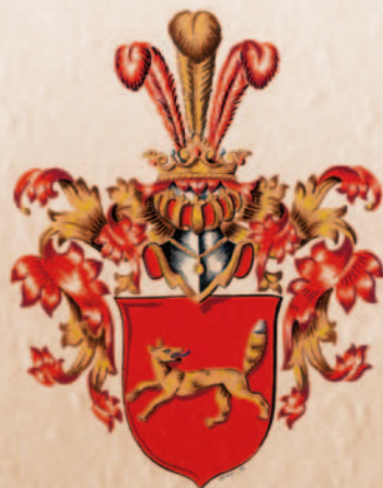
Studénkobé ze S tudénky