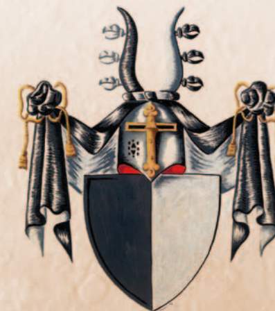
Hříbňáčobé z Heraltic