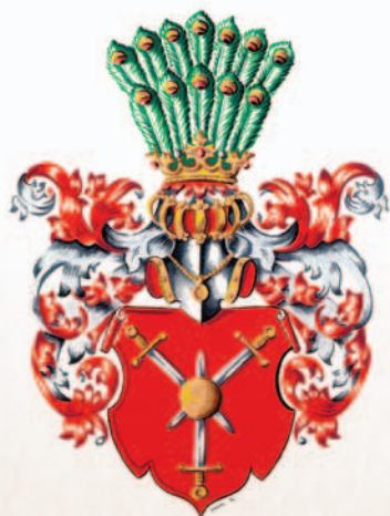
z F ulštejna