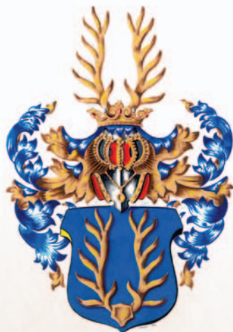
Pražmové z B ílkoba