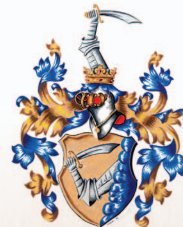
Řepinští z B ereczka