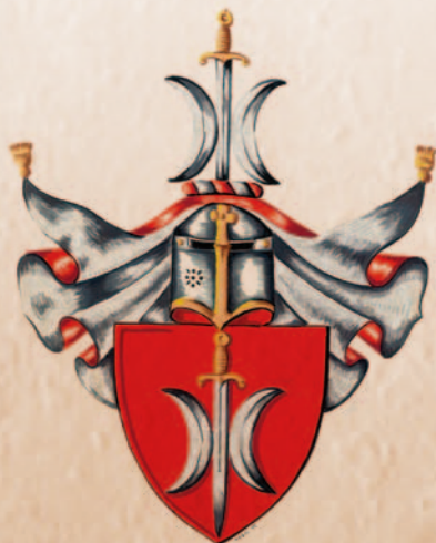
Třebmínští z Třebmínic