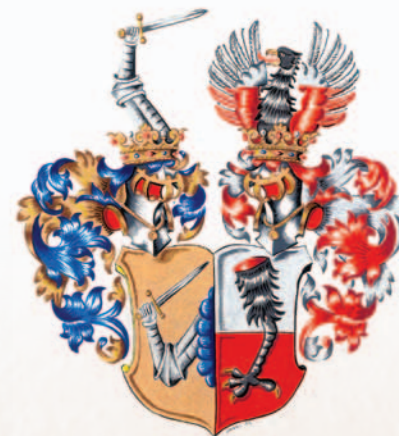
Řepinští z B ereczka