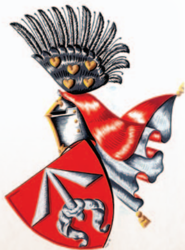
Tvorkobští z Krabař