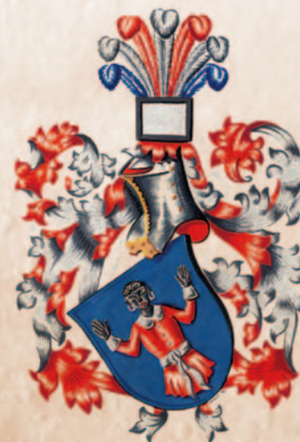
Kobytkobé z Kobyli