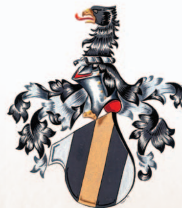
Škrbenští z Doloplaž