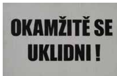
↓ Pohlednice od TIMA naleznete v infocentrech. Více na webu suvienry.ticbrno.cz

kteří před více než sto lety vznikl coby kabaret a tančírna Brüner Fledermaus (Brněnský netopýr). Zavítat sem můžete, ať už vás baví kytary, nebo taneční elektronika. Za progresivní vážnou hudbou zase zajděte na koncerty v sále Janáčkovy akademie múzických umění. Experimentální zvukové umění se odehrává v kavárně PRAHA. Jazz, rock, folk a další žánry můžete poslouchat v hospůdkách a klubech, kterých jsou v Brně desítky. Fenomémem současné brněnské elektronické scény se staly parties v ulicích a parcích. Hrají na nich například místní producenti analogových beatů, kteří jsou často spojeni se světoznámou brněnskou komunitou Bastl Instruments vyrábějící modulární syntezátory.