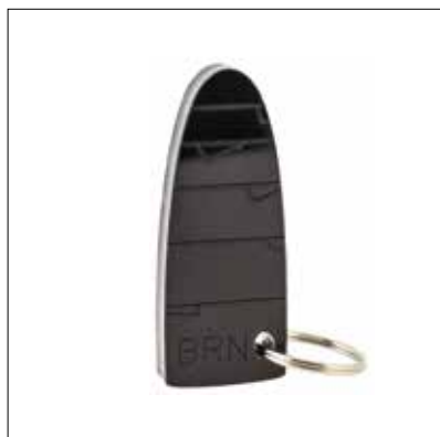
↑ Klíčenka ORLOJ