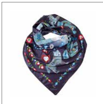
↑ Šátek FOLKLOR