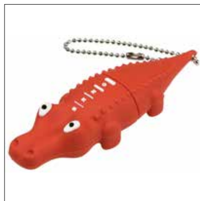
↑ USB Krokodýl