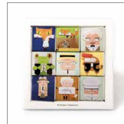
↑ LEOŠ JANÁČEK – čokosada Liška Bystrouška