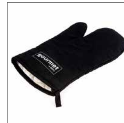
↑ GOURMET chňapka