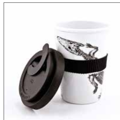
↑ BRNĚNSKÝ DRAK coffee to go