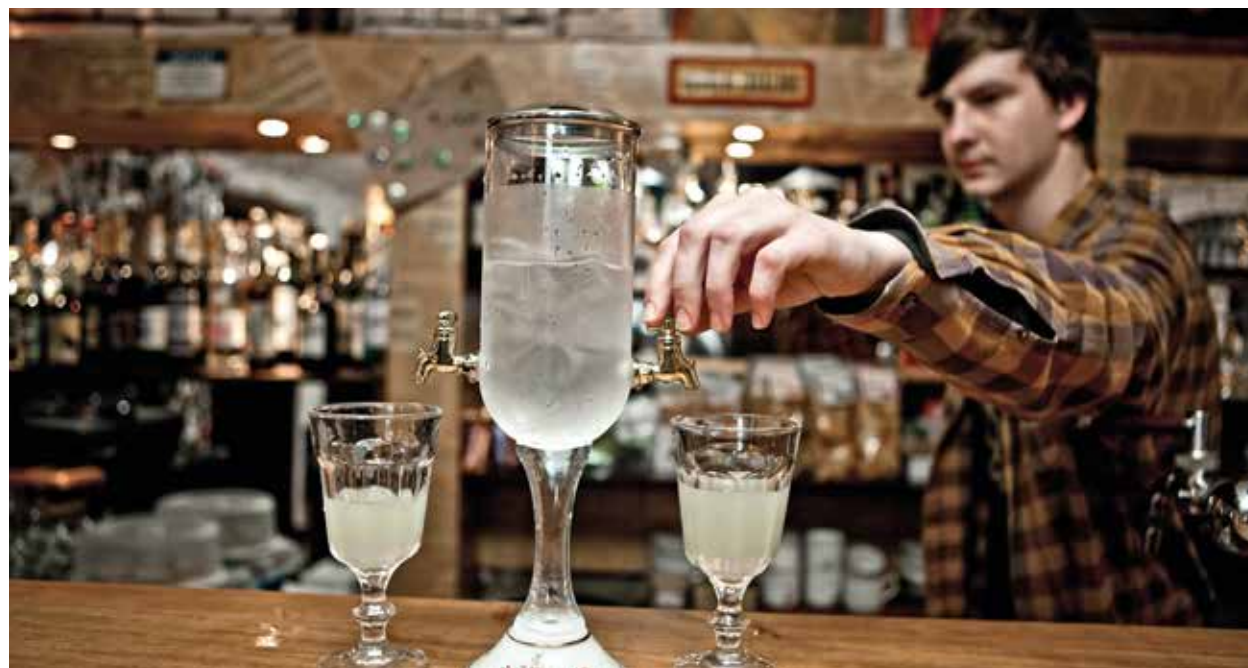
↑ Bar Naproti na ulici Jana Uhra je Mekkou milovníků absintu.

Tradiční místní pokrmy po boku světově vyhlášené kuchyně, to vše připraveno z čerstvých a lokálních surovin, servírované v nápaditých stylových interiérech. I to vás v Brně čeká. Co se týče podniků, je z čeho vybírat. Stojí tu vedle sebe luxusní i lidové restaurace, steakhousy, grill bary, hipsterská bistra, tapas bary