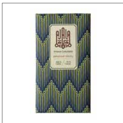
↑ Čokoláda AJALA