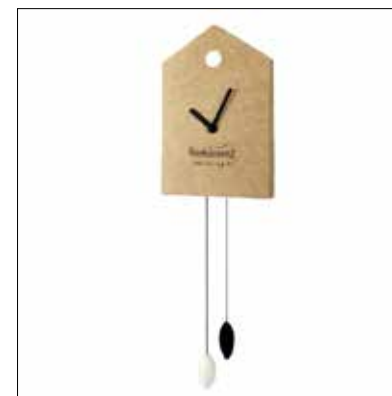
↑ LEOŠ JANÁČEK – nástěnné hodiny