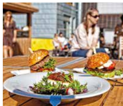
↑ Na středomořskou kuchyni do La Bouchée.

i populární food trucky. Vyberou si i vegetariáni a vegani.