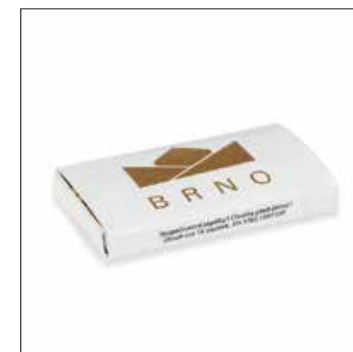
↑ ZLATÁ LOŤ zápalky