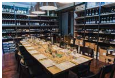
↑ Vino si jakseptří vychutnáte například v Petit Cru.

Už dávno jsou pryč doby, kdy v Brně působil jediný pivovar – Starobrně. Ačkoliv Starobrněnský pivovar stále patří mezi dominanty města a může se chlubit 145letou tradicí, čím dál populárnější se stávají menší místní pivovary, minipivotky a ochutnávkové