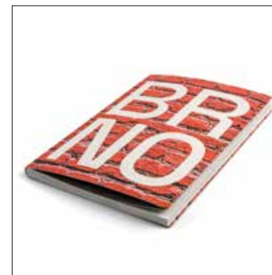
↑ Autentický průvodce TO JE BRNO