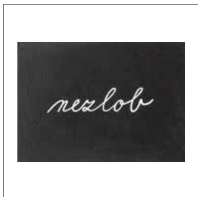
↑ Pohlednice TIMO