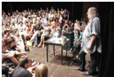
↑ Básník Ivan Jirous coby host festivalu Měsíc autorského čtení.

Brňané rádi čtou a chodí do kina. Už v 18. století se tu zakládaly čtenářské kluby a začaly pravidelně vycházet noviny. Dnes je Brno domovem nejvýznamnějších knihoven, desítek knihkupectví všech velikostí i zaměření a na ulicích v centru potkáte malé knihovničky, kde si můžete vzít knihu dle libosti nebo