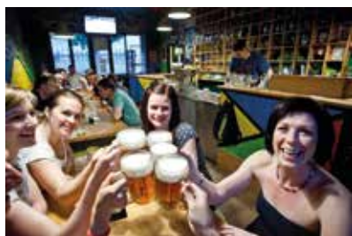
↑ Milovníci pěnivého moku najdou prostředí podle svého gusta v pivnici Na Božence.

Svou nejslavnější éru brněnské kavárny prožívaly v meziválečném období. Mnohým z nich vtiskli funkcionalistickou podobu přední architekti. V současné době má ale Brno opět největší koncentraci kaváren. Budte si jisti, že kavárny, kavárničky či coffee trucky na vás budou vykukovat zpoza každého rohu. Kromě těch moderních narazíte i na podniky, které udržují tradici prvorepublikových kaváren.