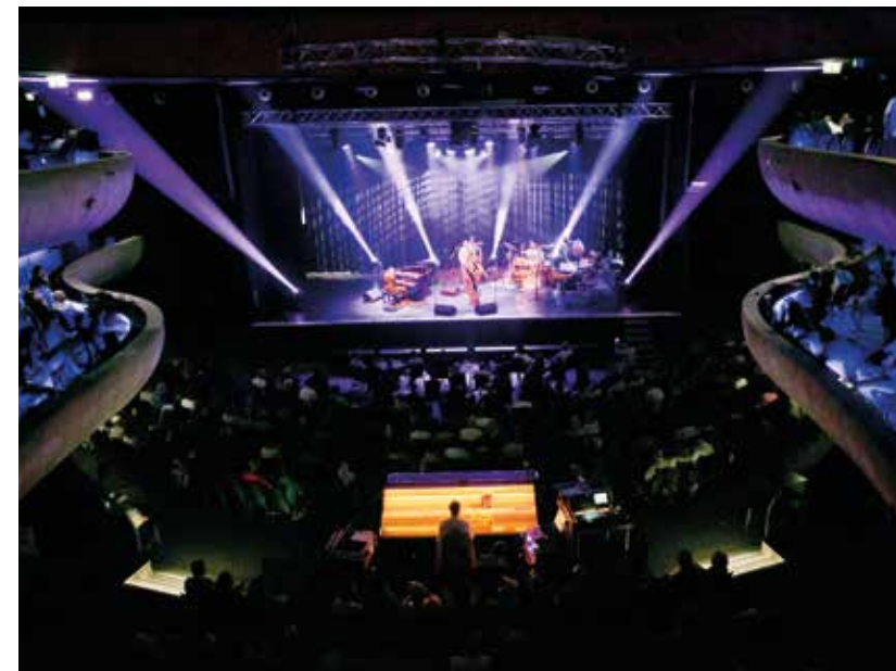
↑ Hudební zážitek na vás čeká například v koncertním sále Sono Centrum.

Koncerty zásadních hudebních postav alternativních scén spolu s nadějnými domácími i místními kapelami lze v Brně zažít několikrát do týdne. Odehrávají se v klubech a sálech, jako je Mersey, Metro, Sono, Kabinet MÚZ. Nejstarší klub je Fléda,