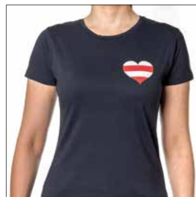
↑ Tričko TIMO