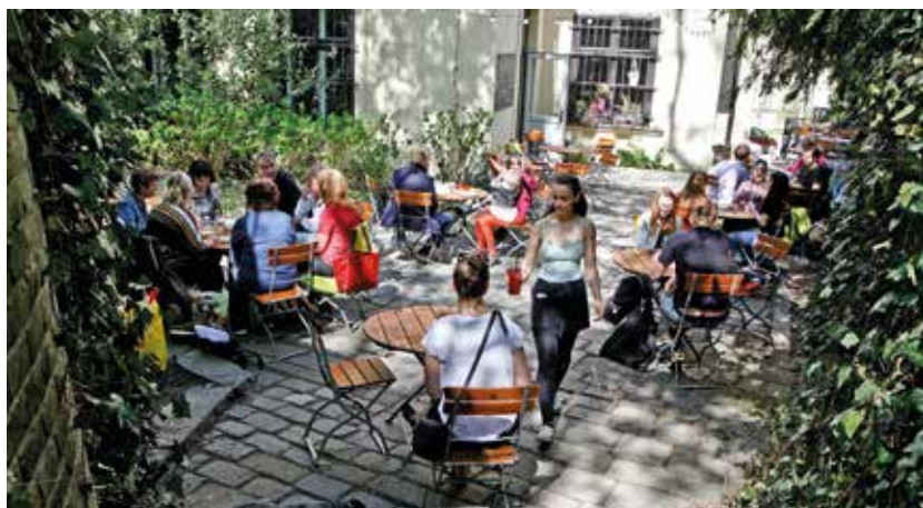
↑ Cafe Podnebí a její útulná zahrádka hned pod Špilberkem.

pivnice. Pokud však po Starobrně zatoužíte, zkuste si ho dopřát stylově, třeba v jedoucí tramvaji – Šalina pubu.