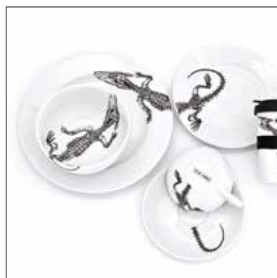
↑ BRNĚNSKÝ DRAK kolekce porcelánu