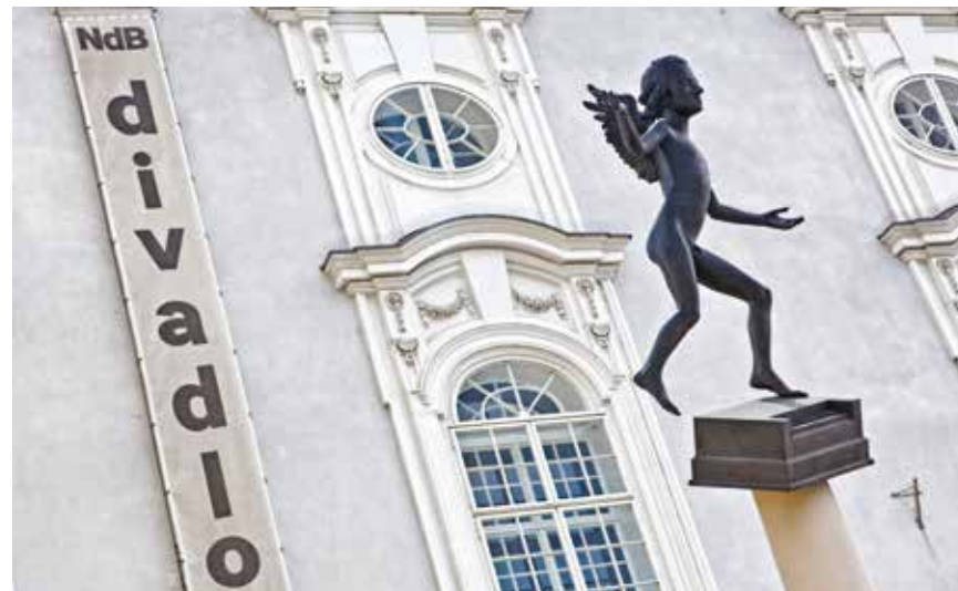
↓ Koncert malého Wolfganga Amadea Mozarta připomíná originální socha před divadlem Reduta.

nebo nezávislé scény BuranTeatr či divadlo Druhý Pád. Bezbariérové Divadlo Barka je otevřené všem divadelním nadšencům bez ohledu na jakékoli omezení.