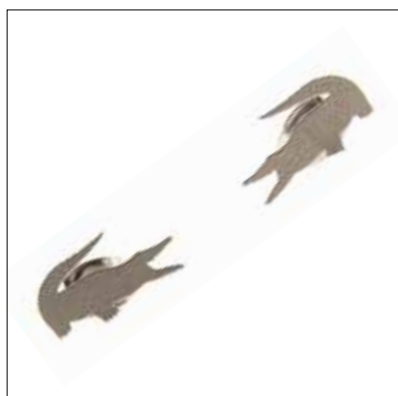
↑ Náušnice KROKODÝL