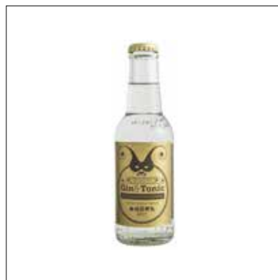
↑ Gin tonic SUPER PANDA