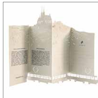
↑ PORIGAMI přání