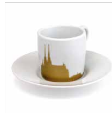
↑ Šálek s podšálkem matný potisk