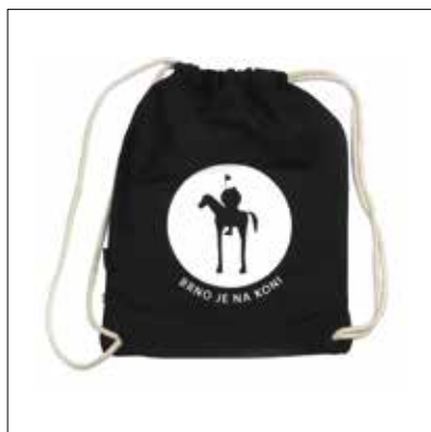
↑ Ruksak JOŠT