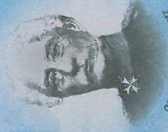
Generál Karl Steinmetz