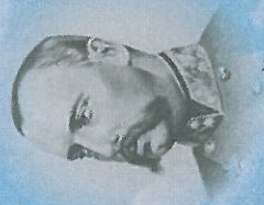
arcivévoda Leopold von Habsburg