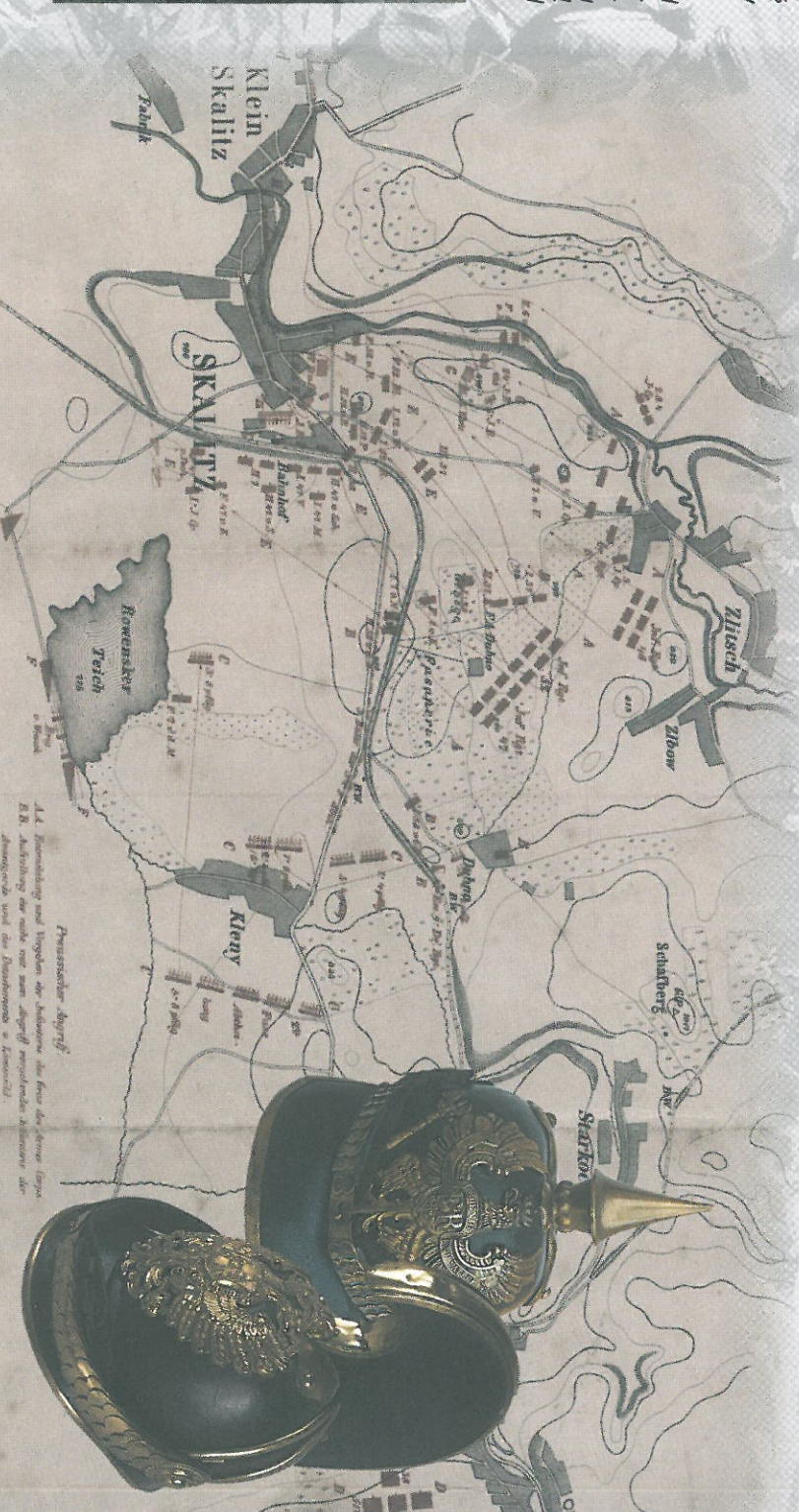
Prussischer Abzug 14. Zusammenhang mit Vorgängen der Schlacht am Frey der Frey (1866) E.B. Abbildung der runde mit dem abgegriffen erhaltene Abbildung der Abzugswache, wird die Prussische in Klenny.