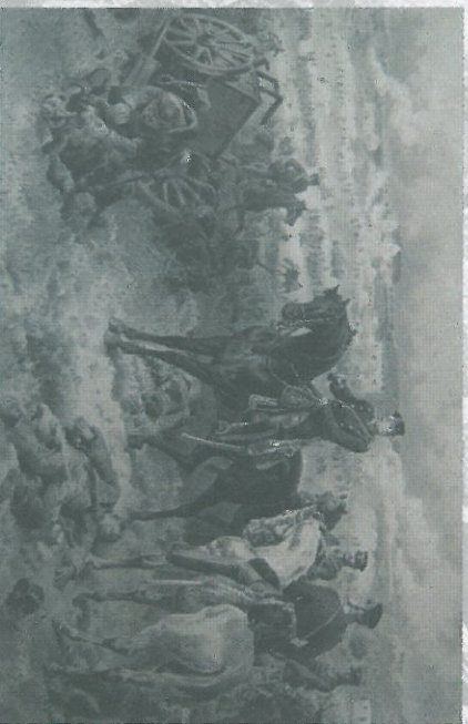
Generál Steinmetz dobývá nádraží i prostor v blízkosti železniční stanice a rozhoduje boj