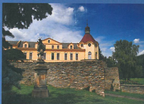
ČERVEN Muzeum textilu