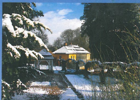
ÚNOR zámecký skleník