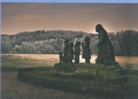
PROSINEC sousoší Babička s dětmi