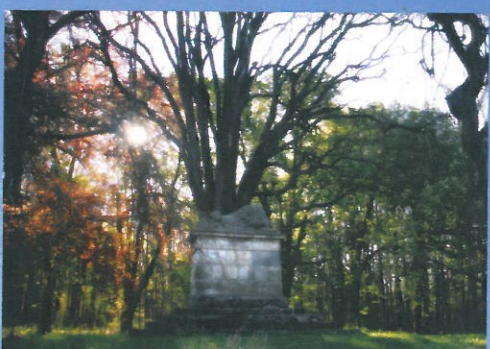
BŘEZEN Spící lev - památník obětím války 1866