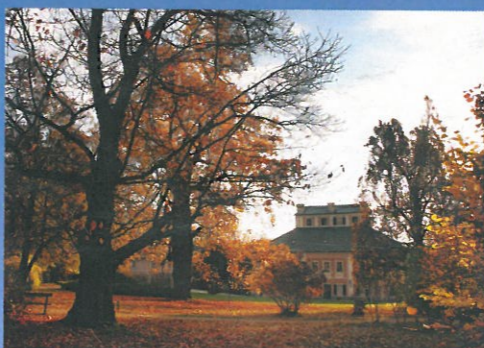
LISTOPAD zámek Ratibořice