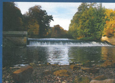
ZÁŘÍ Viktorčin splav