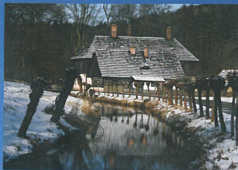
LEDEN Staré bělidlo