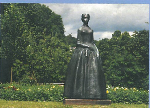
SRPEN socha Barunky Panklové