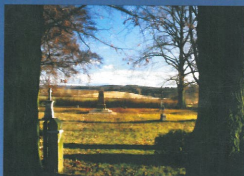
ŘÍJEN vojenský hřbitov 1866