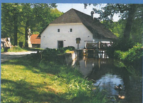
ČERVENEC Rudrův mlýn