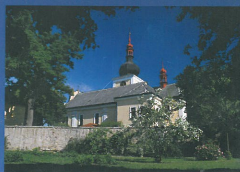
KVĚTEN kostel Nanebevzetí Panny Marie